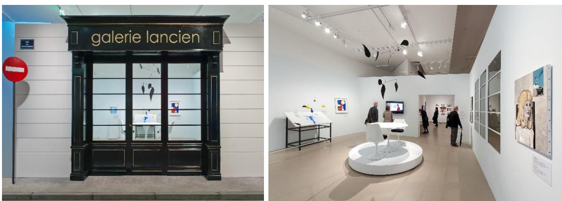
Photographies de l'exposition Le Monde enchanté de Jacques Demy