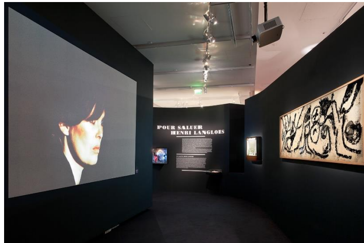
Pour saluer Henri Langlois de Pierre Alechinsky (1957) dans l'exposition Le musée imaginaire d'Henri Langlois (2014)