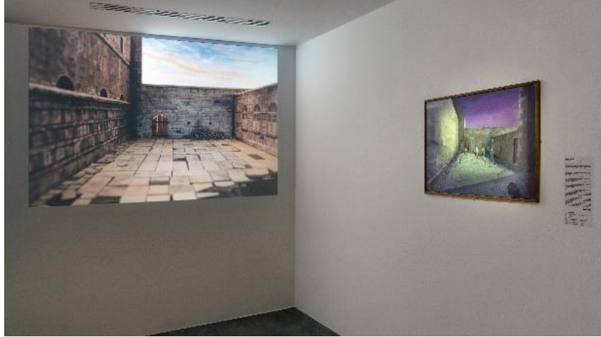
Film de Mathieu Dufois Et ne reste que le décor (2021) à gauche et maquette de décor de Trauner à droite lors de l'exposition Tout un film !