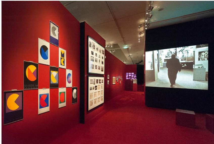
Logos commandés par Henri Langlois à Victor Vasarely pour son Musée du Cinéma présentés à l'exposition Le musée imaginaire d'Henri Langlois (2014)

Langlois ne cesse de tisser des liens entre peinture et cinéma en prêtant une attention particulière à l'illustration des affiches qui présentent ces événements. Elles sont souvent illustrées par des œuvres de ses amis peintres, comme Victor Vasarely à qui il empruntera un des projets de logo ( Ibid. , p. 324) commandé pour son Musée du Cinéma afin d'illustrer le programme, la couverture du carton d'invitation et l'affiche de la première exposition consacrée à Etienne-Jules Marey organisée en 1963 ; exposition pour laquelle Marcel Duchamp, Max Ernst ou encore Gino Severini prêtent des œuvres, illustrant ainsi les liens formels existants entre les travaux de l'inventeur et l'art moderne ( Ibid. , p. 327). En 1972, une œuvre de Fernand Léger orne l'affiche de l'exposition Trois quarts de siècle de cinéma mondial 11 , et inaugure l'ouverture de son Musée du Cinéma de Chaillot.