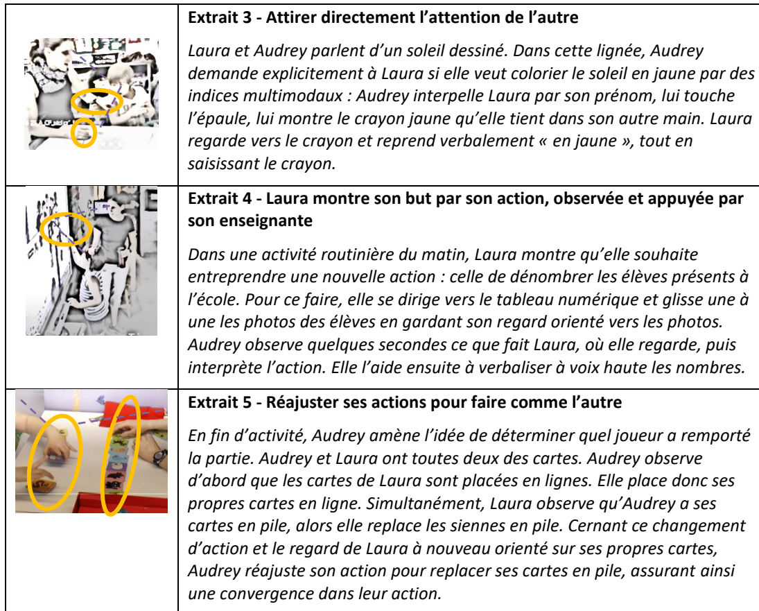
Figure 3. Différentes manières d'attirer l'attention de l'autre pour obtenir son attention conjointe et orienter conjointement leurs buts/coordonner l'action.

figure 3 illustre trois manières pour Audrey et Laura de combiner différents indices pour ajuster leur attention conjointe lors de différentes activités à table, que ce soit en tête à tête ou dans une activité de groupe. Plus spécifiquement, l'extrait 5 montre comment il est parfois nécessaire de réajuster les actions pour garantir que l'attention conjointe des deux participantes soit alignée sur les mêmes buts, permettant ainsi d'entreprendre une action partagée.