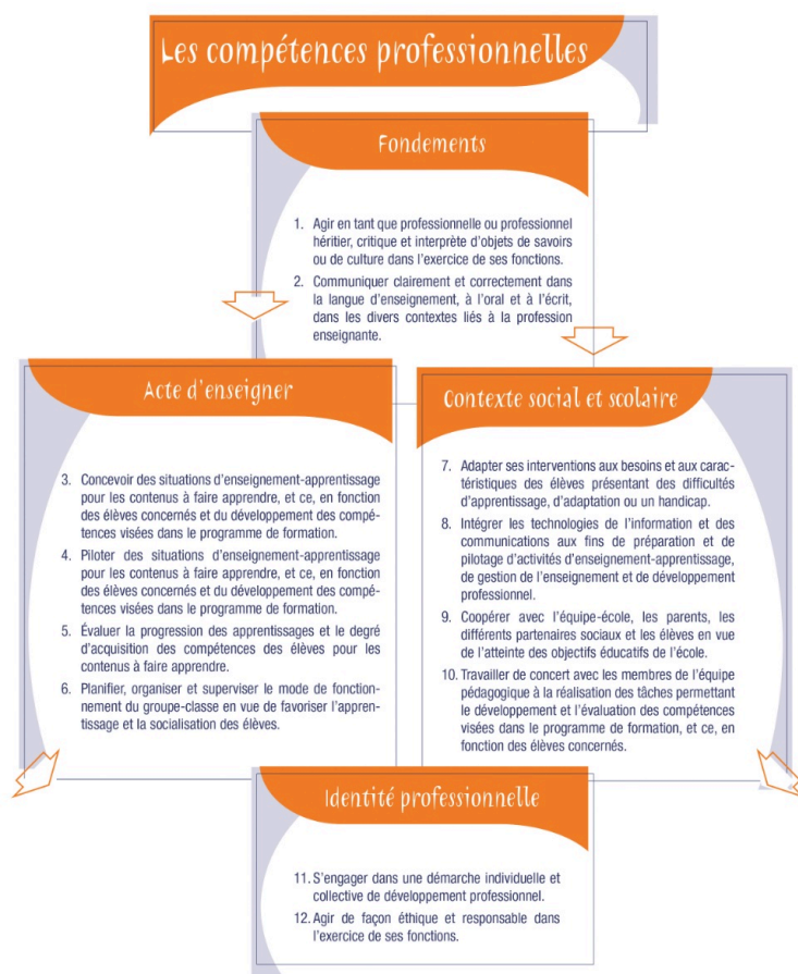
Figure 1 : 12 compétences professionnelles organisées en 4 catégories (MEQ, 2001, p. 59)

La dimension formative de l'évaluation se repère par deux caractéristiques présentes dans une grille. La première caractéristique concerne l'espace accordé aux commentaires dans le document. La deuxième caractéristique correspond aux types de commentaires demandés. Ces caractéristiques témoignent de la prise en compte, d'un point de vue théorique, de la dimension formative par les concepteurs d'une grille d'évaluation en stage.