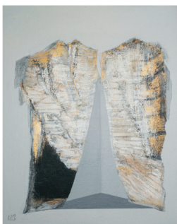
La cour des autres

Avril 2021 Vol. XV, n° 3 L'Action NATIONALE