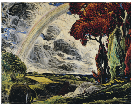
Marc-Aurèle Fortin, L'Arc-en-ciel, 1934 ou 1935 © Fondation Marc-Aurèle Fortin / SOCAN (2020)