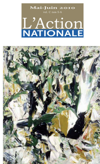
Pierre Vadeboncoeur, un homme libre