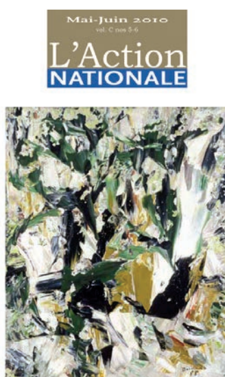
Pierre Vadeboncoeur, un homme libre