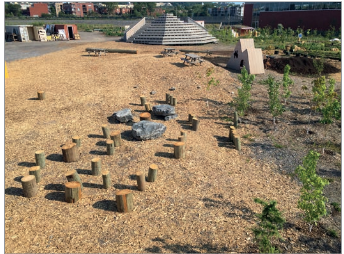
ILL. 28. DES INSTALLATIONS FLEXIBLES SUR L'ESPLANADE DU VIRAGE À PARTIR DE MATÉRIAUX RÉCUPÉRÉS. | JONATHAN CHA.

partagée des organismes de créer un écosystème humain et écologique signe de changement dans la société.