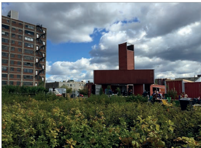
ILL. 20. LES JARDINS ÉPHÉMÈRES ENTOURANT LE VIRAGE. | JONATHAN CHA.

réalité et une attente grandissantes pour la population. Le prototypage du Virage et des projets éphémères dépasse les limites de la pratique urbanistique habituelle. Il offre à l'Université de Montréal et à la Ville de Montréal la possibilité « d'intervenir entre les réalités et les potentialités », la flexibilité dans la planification et l'élaboration des politiques, tout en gardant les choses ouvertes, tandis que des solutions provisoires sont anticipées, développées ou rejetées 49 .