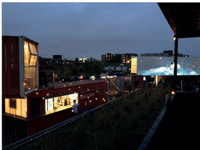
ILL. 33. LE VIRAGE LA NUIT AVEC UNE PROJECTION DE « MOMENT FACTORY ». | JONATHAN CHA.