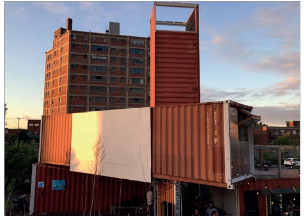
ILL. 14. LE VIRAGE ET LA CONTINUITÉ DES ARCHITECTURES. | JONATHAN CHA.