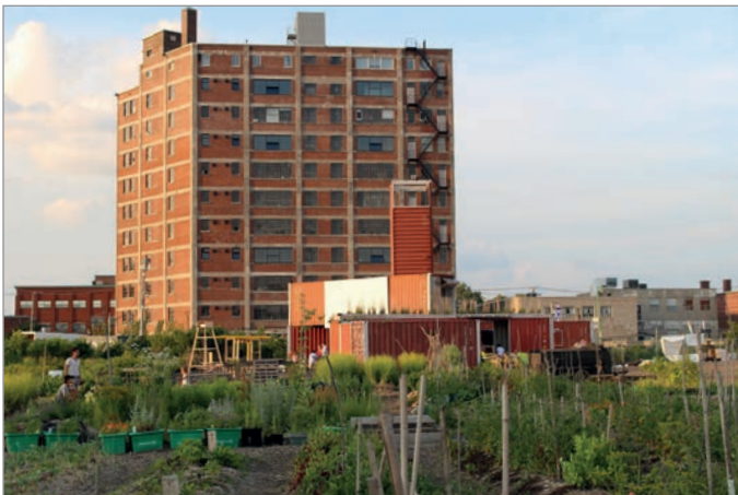
ILL. 15. LE SITE DES PROJETS ÉPHÉMÈRES COMPOSÉ DES JARDINS ET DU VIRAGE ET L'ÉDIFICE DU 400, AVENUE ATLANTIC. | CAMPUS MIL, UNIVERSITÉ DE MONTRÉAL.