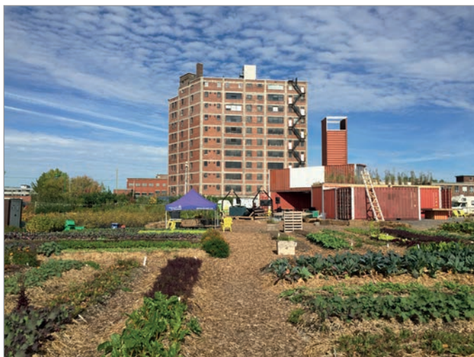
ILL. 21. LES JARDINS ÉPHÉMÈRES ENTOURANT LE VIRAGE. | JONATHAN CHA.