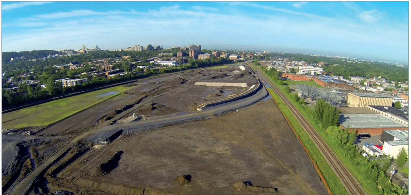
ILL. 2. LE NIVELLEMENT DE L'ANCIENNE COUR DE TRIAGE DU CANADIEN PACIFIQUE ET LE REPOSITIONNEMENT DES VOIES FERRÉES. | CAMPUS MIL, UNIVERSITÉ DE MONTRÉAL.