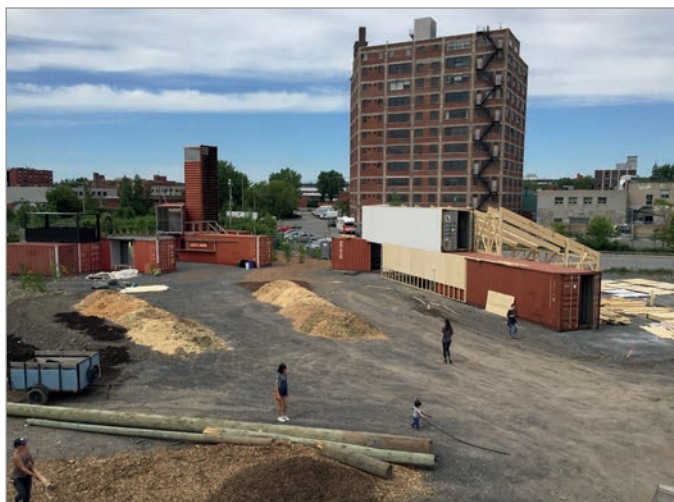
ILL. 23. LE GRAND HALL DU VIRAGE EN CONSTRUCTION ET L'ÉVOLUTION DES SURFACES AU SOL. | JONATHAN CHA.