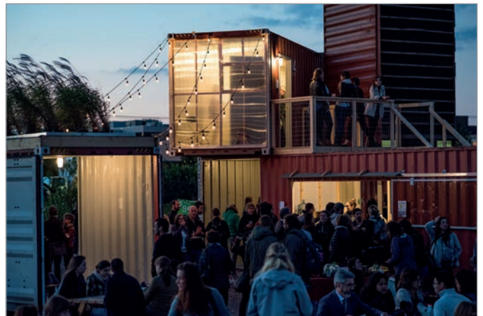
ILL. 16. LE VIRAGE. | MONTRÉAL VILLE EN MOUVEMENT, MATHIEU DESHAYES.

dans cette étude de cas comme « things we make to find out things 45 ». Dans l'approche associée à la fabrique de l'espace public, le prototypage présente des défis intéressants à mettre en œuvre par les praticiens et à étudier par les chercheurs. Le prototypage du Virage peut être compris comme « un artefact précurseur holistique du produit final 46 » et encore plus comme « la permission d'expérimenter 47 », puisqu'il est implanté sur la propriété de l'Université de Montréal qui a conclu des ententes pour permettre à l'OBNL MVM d'utiliser ses terrains. Le prototype du Virage cherche à repenser notre manière de concevoir et de pratiquer l'espace