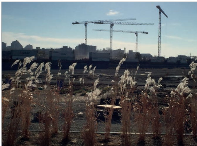
ILL. 3. LE SITE DES PROJETS ÉPHÉMÈRES, 2016. | MARYLÈNE PERRAS.