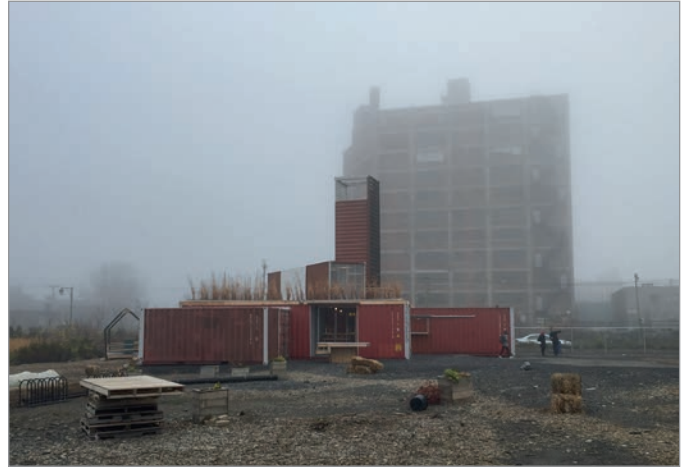
ILL. 10. L'AMBIANCE DE PAYSAGE INDUSTRIEL DU SITE DES PROJETS ÉPHÉMÈRES, DU VIRAGE ET DE L'ÉDIFICE DU 400, AVENUE ATLANTIC. | MARYLÈNE PERRAS.

de Smet définit trois groupes d'acteurs et d'objectifs menant à la réalisation d'espaces temporaires : l'opportunisme (qui profite d'une situation spécifique), l'activisme (qui milite pour une cause en adoptant une attitude critique) et l'auto-organisation (qui porte l'idéologie de produire une ville meilleure par une approche bottom up ). Le Virage 31 répond particulièrement aux premier et troisième groupes et pourrait être « un exemple d'urbanisme temporaire qualifié d'assemblages précaires d'expressions matérielles et identitaires 32 ». Le Virage n'est ni militant ni revendicateur, mais s'inscrit néanmoins dans la remise en cause de l'urbanisme néolibéral 33 . Approuvé d'entrée de jeu par des institutions publiques, il est né de l'opportunité d'investir une parcelle de terrain appartenant à l'Université de Montréal sur son futur campus MIL et d'un financement obtenu de la Ville de Montréal en vertu du Plan de développement urbain, économique et social (PDUES) des secteurs Marconi-Alexandra, Atlantic, Beaumont et De Castelnau. C'est ainsi qu'un terrain expérimental contrôlé et un financement ont été obtenus 34 . La démarche a été initiée et réalisée conjointement entre