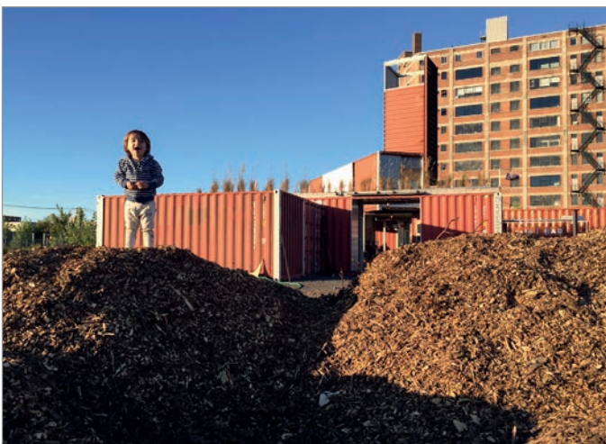
ILL. 19. AIRE DE JEU INFORMELLE AU VIRAGE POUR LE PLAISIR DES TOUT PETITS. | JONATHAN CHA.