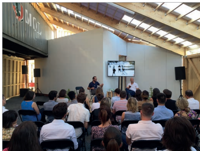
ILL. 30. UNE CONFÉRENCE DANS LE GRAND HALL AU VIRAGE. | JONATHAN CHA.

par la consommation générique ou le spectacle à grand déploiement où les gens se tiennent à distance socialement. En venant sur le site du Virage et des projets éphémères, on vit une expérience d'espace public inédite par l'acquisition de connaissances, le contact avec les autres et l'action sur le site. Cette approche permet une participation accrue, mène à un engagement citoyen puis à un sentiment d'appartenance. Une telle programmation nécessite toutefois de grandes ressources humaines et financières en termes de conception artistique, de production de contenu, de coordination et de communications, pour aller rejoindre les citoyens de tous horizons, sans parler des équipements qui peuvent être utiles pour des activités à moyen ou grand déploiement (écrans, projecteurs, systèmes de son, lumières, etc.). Il faut beaucoup d'énergie et d'investissements pour livrer et engager cette expérience citoyenne si cruciale au prototype du Virage. Malgré le succès de son programme, le nombre de participants est souvent demeuré faible, en deçà des attentes par rapport à la qualité de l'expérience proposée. Ceux présents y étaient toutefois fortement engagés.