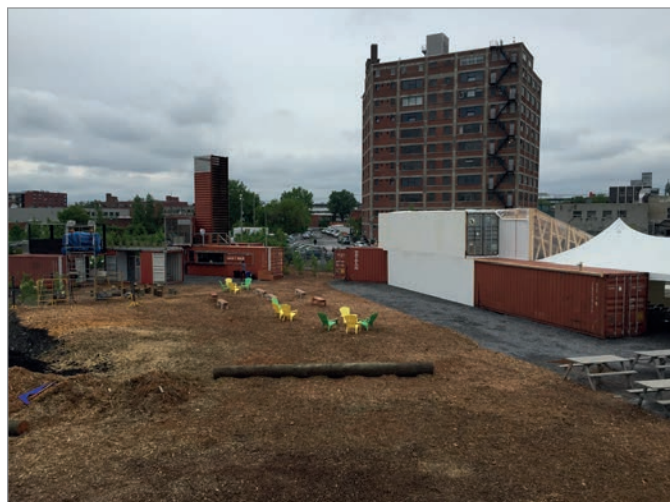
ILL. 24. L'ESPLANADE ET LE GRAND HALL DU VIRAGE. | JONATHAN CHA.

de la Faculté de l'aménagement de l'Université de Montréal (architecture, architecture de paysage, design d'intérieur, design industriel, urbanisme). Dans des concours prenant la forme de workshops, des professeurs, des chargés de cours et des professionnels ont supervisé, jugé et sélectionné les propositions les plus originales et réalistes. Les étudiants ont par la suite été encadrés (sous forme de stages) par MVM et des bureaux professionnels et ont participé au processus de coconstruction du lieu en usine et in situ , en collaboration avec de jeunes diplômés et des entrepreneurs 54 . Ce type d'approche très structurée misant sur la multidisciplinarité et la formation n'est pas sans heurts (difficulté à trouver des étudiants motivés et disponibles, beaucoup de temps d'encadrement et de logistique, manque d'expérience des intervenants, difficulté d'avoir des professionnels expérimentés en raison des faibles ressources financières, collaboration nécessaire entre les acteurs, temps limité), mais a l'intérêt de passer rapidement de l'idée à la réalisation, de favoriser l'expérimentation et de forcer « les designers à vivre et à observer intensément le site du projet 55 ».