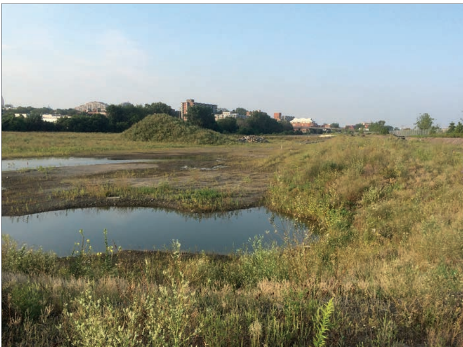
ILL. 1. LA FRICHE DE L'ANCIENNE COUR DE TRIAGE DU CANADIEN PACIFIQUE AVANT LE DÉBUT DU PROJET. | CAMPUS MIL, UNIVERSITÉ DE MONTRÉAL

Le Virage est le nom d'un espace extérieur formé d'un assemblage de conteneurs recyclés entouré de jardins potagers (projets éphémères) implanté pour une durée limitée (5 ans) et destiné à recevoir des activités éducatives, publiques et