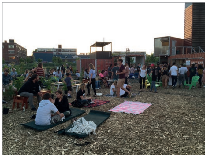
ILL. 26. OCCUPATION CITOYENNE LORS D'UNE SOIRÉE D'ÉTÉ AU VIRAGE. | JONATHAN CHA.

institutionnel initial derrière ce jardin collectif en est un d'acceptabilité sociale liée aux nuisances du chantier, à l'arrivée de milliers de personnes et aux effets possibles d'embourgeoisement du quartier Parc-Extension. Ces intentions institutionnelles n'ont pas empêché les acteurs et les organismes impliqués dans la création des jardins de mettre de l'avant une pensée orientée vers les systèmes naturels, l'écologie, la biophilie et le biomimétisme.