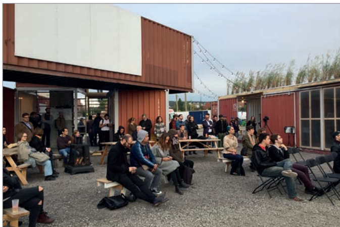
ILL. 17. UNE CONFÉRENCE EXTÉRIEURE DANS L'AGORA DU VIRAGE. | JONATHAN CHA.