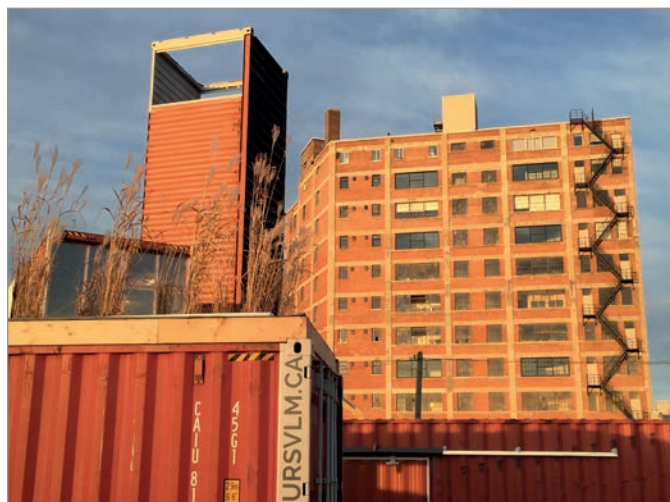
ILL. 8. LE VIRAGE ET L'ÉDIFICE DU 400, AVENUE ATLANTIC. | JONATHAN CHA.

apparaissent dans la ville néo-libérale créative et participative 14 sont des indicateurs de nouvelles formes de citoyenneté 15 et illustrent l'attention portée aux espaces publics et à ses appropriations citoyennes en temps de crise. Les projets temporaires remplissent ainsi le vide entre une économie urbaine changeante et un paysage urbain changeant 16 . Selon Florian Haydn et Robert Temel, « les usages temporaires sont ceux qui cherchent à tirer des qualités uniques de l'idée de temporalité 17 ». Ils deviennent ainsi, pour Geneviève Vachon, Érick Rivard et Alexandre Boulianne, des indicateurs d'une nouvelle manière d'occuper et de construire l'espace public et des « révélateurs d'enjeux urbains, de lieux sous-utilisés et d'actions transformatives concrètes 18 ». Le prototype du Virage s'inscrit dans cette dynamique, celle qui admet la crise de l'espace public et qui accepte que « le projet est l'affaire d'un nombre croissant de personnes, intervenant à tout moment d'un processus qui n'est plus linéaire 19 ». Pour Denis Delbaere, cet objet auto-institué compromet l'espace public comme forme. La forme n'est plus ce qui doit advenir, mais est déjà là, l'espace public est à penser