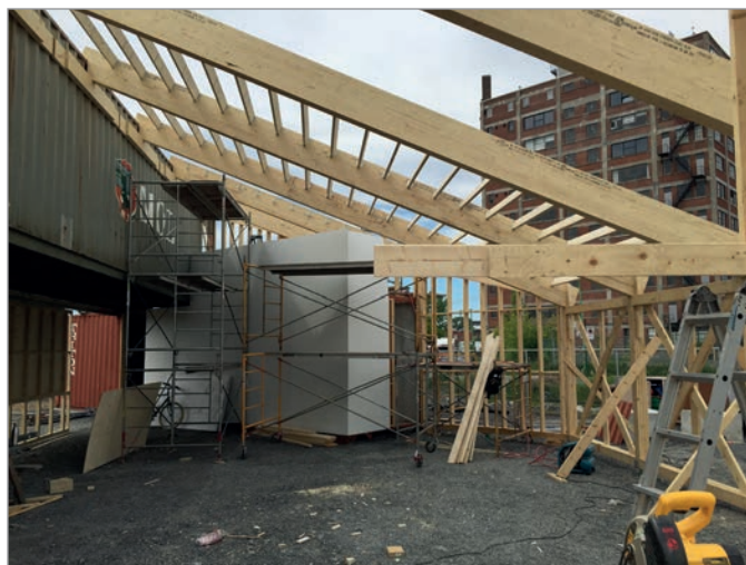
ILL. 22. LE GRAND HALL DU VIRAGE EN CONSTRUCTION.

cède gratuitement [d]es espaces à des collectifs et à des associations, recensés dans le fichier municipal des entités citoyennes sans but lucratif ( Fitxer General d'Entitats Ciutadanes ), pour qu'elles les aménagent en y implantant des activités d'intérêt public ou d'utilité sociale. Les activités proposées doivent être temporaires, se développer dans des structures provisoires et présenter un caractère éducatif, sportif, ludique, culturel ou artistique 51 .