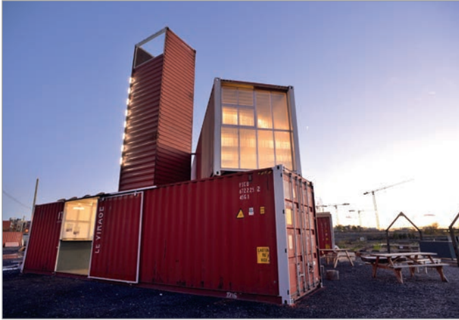
ILL. 9. LE VIRAGE ET L'ARCHITECTURE LUMINEUSE DES CONTENEURS COMME « SIGNAL » URBAIN. | MARYLÈNE PERRAS.