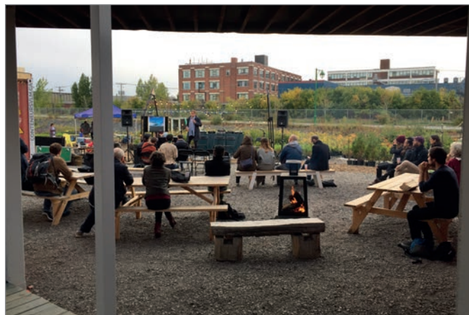
ILL. 18. UNE CONFÉRENCE EXTÉRIEURE DANS L'AGORA AU VIRAGE VUE DEPUIS LE PASSAGE COUVERT. | JONATHAN CHA.