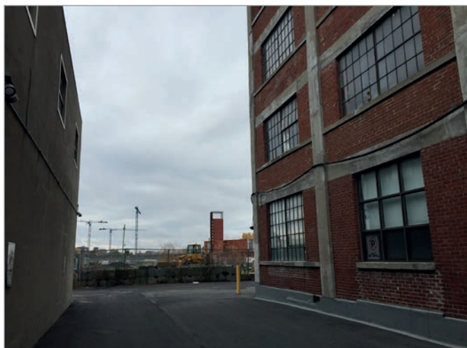
ILL. 7. VUE VERS LE VIRAGE DEPUIS UNE RUELLE DU MILE-EX.