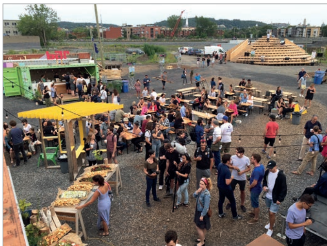
ILL. 31. UN ÉVÈNEMENT GASTRONOMIQUE AU VIRAGE; À L'ARRIÈRE-PLAN, UNE VUE SUR L'INSTALLATION DU « MONT RÉEL ». | JONATHAN CHA.