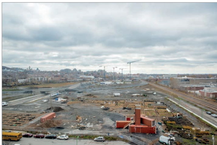
ILL. 5. LE SITE DES PROJETS ÉPHÉMÈRES, DU VIRAGE ET DU CAMPUS MIL. | CAMPUS MIL, UNIVERSITÉ DE MONTRÉAL