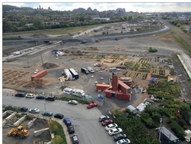
ILL. 6. LE SITE DES PROJETS ÉPHÉMÈRES, DU VIRAGE ET DU CAMPUS MIL. | JONATHAN CHA.

publics 2 . Des leçons pourront être tirées de cette expérimentation particulière qui n'a pas été sans défis et enjeux.