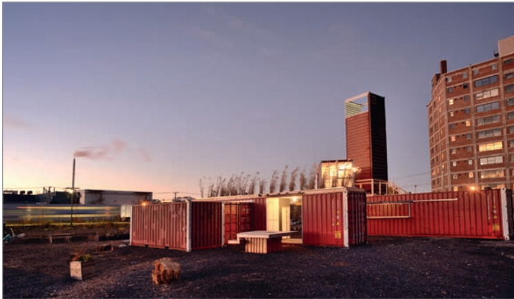
ILL. 13. LA LUMIÈRE DANS LE PAYSAGE DU VIRAGE. | MARYLÈNE PERRAS.