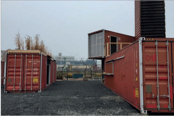
ILL. 11. LE CŒUR DE L'ASSEMBLAGE D'ESPACES ET DE VOLUMES DU VIRAGE ET LES TRAINS DE MARCHANDISES EN MOUVEMENT. | MARYLÈNE PERRAS.