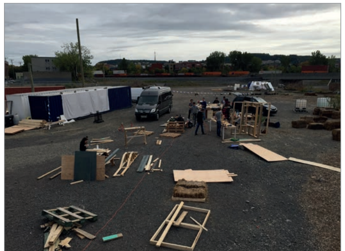
ILL. 4. ATELIER DE COCONSTRUCTION AVEC LES ÉTUDIANTS. | JONATHAN CHA.

culturelles. Il est situé à l'angle des avenues Atlantic et Durocher au cœur de l'île de Montréal, sur le site du futur campus MIL de l'Université de Montréal.