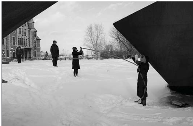
> Gare VIA rail, Québec, février 2014.

« Est membre du Tas quiconque participe au Tas. » « Ce n'est que dans l'action que Le Tas existe. » Ces mots, prononcés autour d'une table, dans un café, quelques minutes après une action, décrivent selon moi ce qui est l'essence du Tas : sans permanence, sans forme, malléable, inclusif, subversif, invisible. Pour le reste, puisque ce n'est que dans l'action qu'il existe, ce n'est que dans l'action que l'on peut espérer comprendre réellement ce qu'il est.