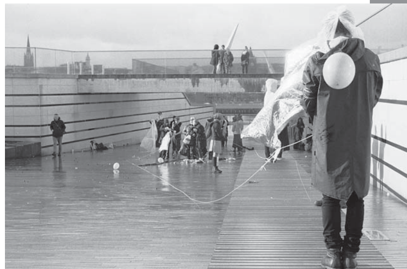
> Derry, octobre 2014.

Nous adhérons à la horde, à ce groupe d'artistes indisciplinés à tous les points de vue, ce qui signifie pour nous des lieux, des temporalités et des attitudes multisensorielles marqués par la relativité (les décalages, les variations, les contrastes, les immatérialités, les mouvances, les sonorités et autres énergies et antimatières poétiques dans la Cité anonyme). Bref, la liberté de, par et pour l'art dans nos vies. ◀