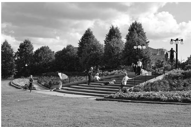
> Gatineau, août 2014.

Ils manifestent l'envie d'être l'Être simultanément. S'il n'y a plus de distinction à faire entre les préoccupations de l'art et celles de la vie, pratiquons dans un univers où nul n'est initié. Par la rencontre nous discuterons et chercherons ensemble, de manière dynamique, un endroit où aller.