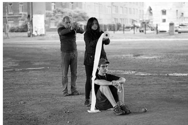
> Québec, septembre 2014.

Le contexte étrange de ces rencontres peut donner naissance à des microévénements éphémères partagés entre deux êtres, à des échanges incongrus autant sur le plan humain qu'artistique. Ainsi, la structure de ces conversations mouvantes doit rester ouverte et muable afin d'inclure tous ceux qui sont susceptibles de s'y intéresser. Enfin, la voie doit être libre pour toutes les éventualités.