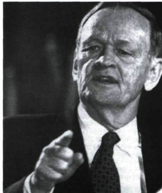
M. Jean Chrétien, premier ministre du Canada.