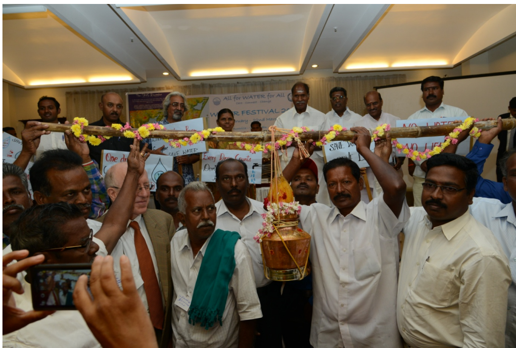
Image1. Inauguration du festival de l'eau, février 2016. Politiciens, agriculteurs, membres d'ONG et autres participants portant le pot à eau qui allait recueillir les eaux du territoire.