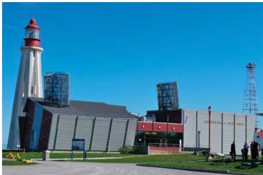
↑ Au Site historique maritime de la Pointe-au-Père, le Musée Empress of Ireland raconte l'histoire de ce paquebot et de la plus grande tragédie maritime du Canada.

Sa situation au cœur du village a valu au phare de La Martre (1906) le surnom de « Cadillac des phares ». Les quatre gardiens qui s'y sont succédé n'ont pas eu à endurer l'isolement qu'impose généralement leur métier. Le bâtiment de structure octogonale se démarque par son ossature en bois, unique sur la côte gaspésienne. Sans compter que son horlogerie d'origine assure toujours la rotation de son module d'éclairage. Tout près, le Musée des phares présente une exposition permanente sur l'évolution des lanternes de phares de 1700 à aujourd'hui.