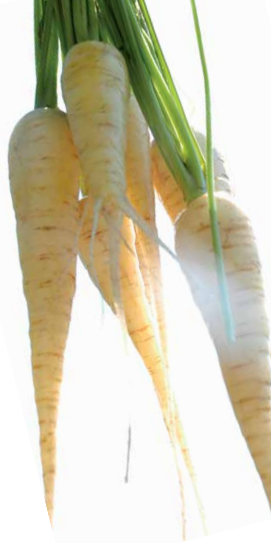
La carotte blanche de Küttingen est une ancienne variété suisse du canton d'Argovie.

En devenant membre de Semences du patrimoine, un réseau canadien d'échange et de préservation de semences à pollinisation libre, on peut se procurer ou distribuer des semences de variétés traditionnelles de fleurs, de fruits, de légumes et d'herbes médicinales. Info: seeds.ca/fr.php