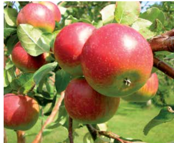
La pomme Fameuse est l’une des plus anciennes et des plus réputées du Québec.

« Chez Ruralys, on voulait revaloriser ces variétés anciennes [de prunes, de pommes, de poires], les répertorier, les sauvegarder et les remettre en circulation », raconte Dominique Lalande. Un colossal travail de repérage a d’abord été effectué pour