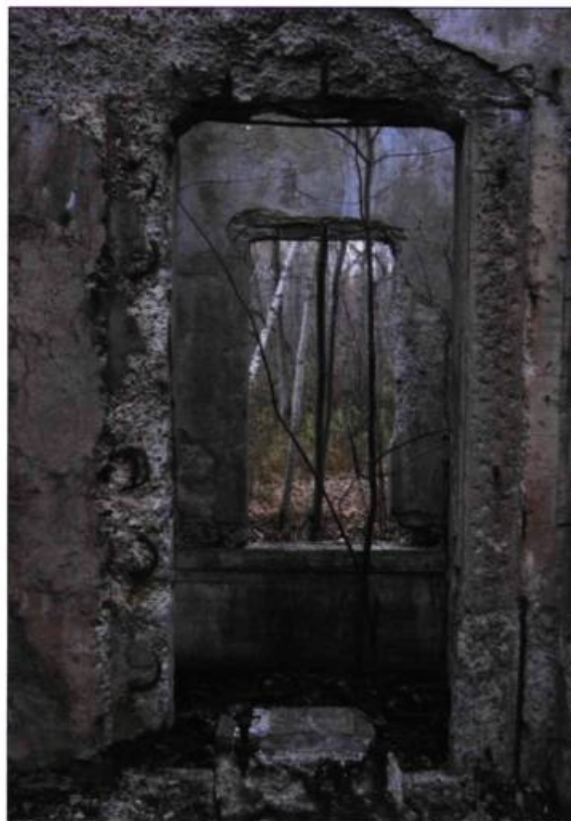
Ruines d'une fabrique de bombes abandonnée à Blainville