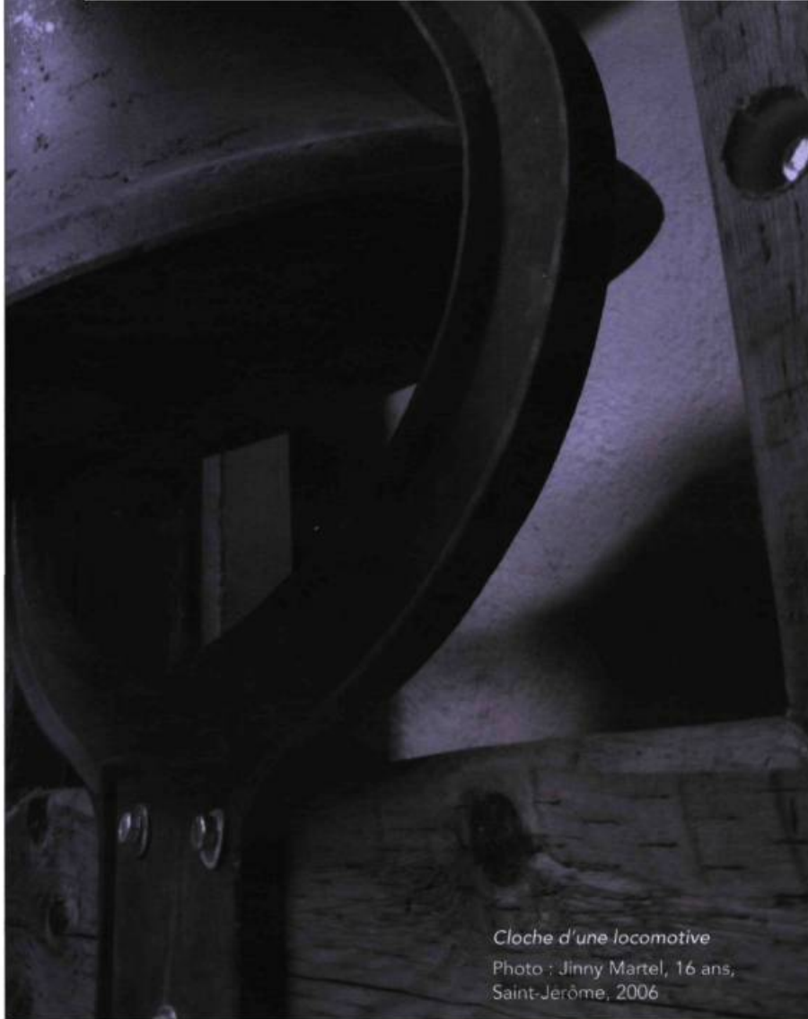
Cloche d'une locomotive