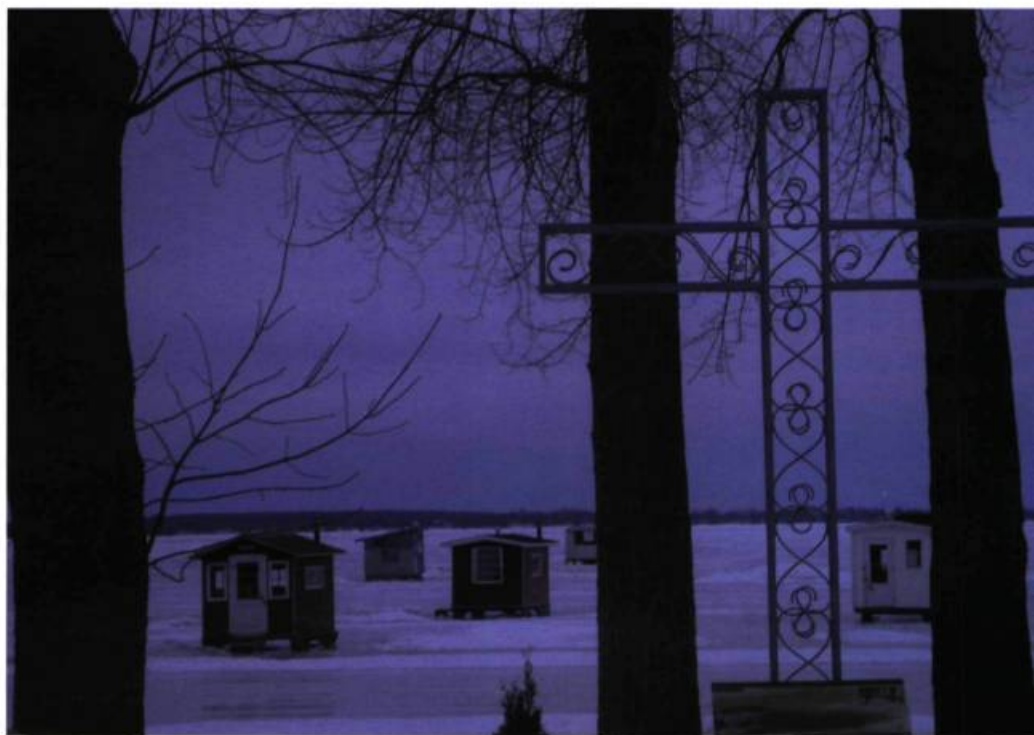
Cabanes de pêche sur glace sur le lac des Deux-Montagnes, à Oka

Une tradition à maintenir ? Tout à fait. Car cette activité permet de véhiculer des valeurs essentielles : sens de la responsabilité des jeunes générations, début d'affirmation de la citoyenneté, ancrage de la mémoire collective, antidote à l'exclusion et à l'intolérance par l'entremise de la culture, éveil