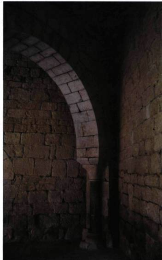
Arche du monastère de Santa Maria de Vilabertran, en Catalogne. L'ensemble monumental roman a été érigé entre le XI e et le XIV e siècle.