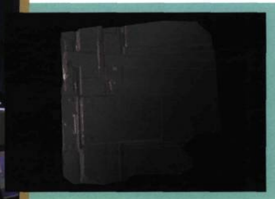
Modèle 3D d'une serrure d'époque obtenu à l'aide d'un scanneur laser 3D.