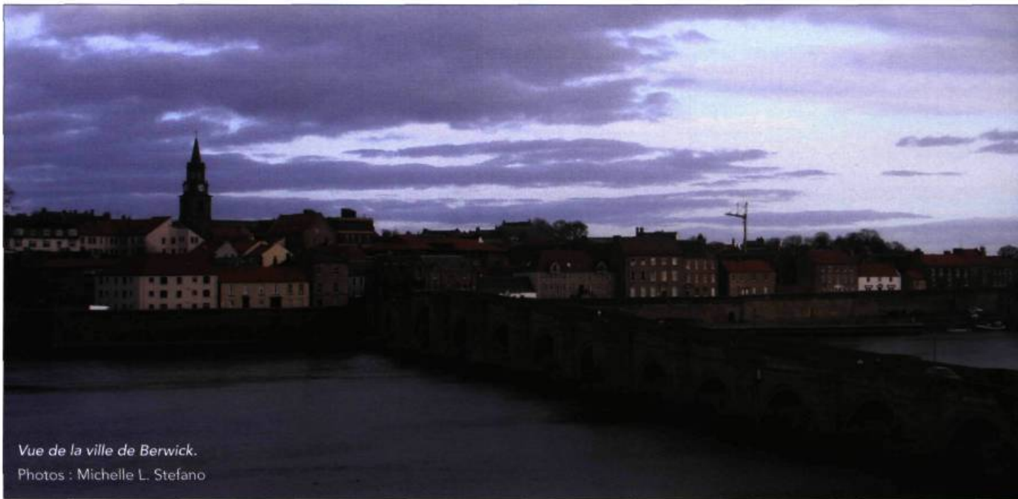
Vue de la ville de Berwick.