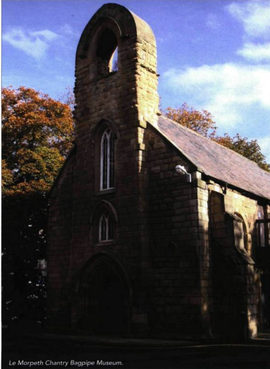
Le Morpeth Chantry Bagpipe Museum.

ont la chance de se rencontrer et d'exprimer l'esprit du lieu qu'ils ont en commun.