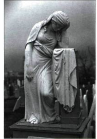
La Pleureuse, œuvre du sculpteur Jean-Baptiste Côté.

Avec leurs lieux naturels, leurs monuments, leurs sites, leurs sculptures et les rites dont ils sont le théâtre, les cimetières sont d'une grande richesse patrimoniale. Afin de la mettre en valeur, le Musée du Château Dufresne offre l'exposition « Le Patrimoine funéraire, un héritage pour les vivants », réalisée avec la collaboration de l'ethnologue Jean Simard et de son équipe. Réunissant une sélection d'objets funéraires, d'œuvres d'art sacré et de photographies de cimetières de François Brault, l'ensemble brosse un portrait de l'évolution des cimetières au Québec depuis la Nouvelle-France. On y trouve des bijoux de notre patrimoine funéraire datant du XIX e et du début du XX e siècle : des croix de fer, des sculptures religieuses, des monuments funéraires et de l'ornementation de corbillard, de même que des œuvres de Jean-Baptiste Côté, Louis-Philippe Hébert et Alfred Laliberté. Jusqu'au 30 août. Montréal. Info : 514 259-9201 ou www.chateaudufresne.com