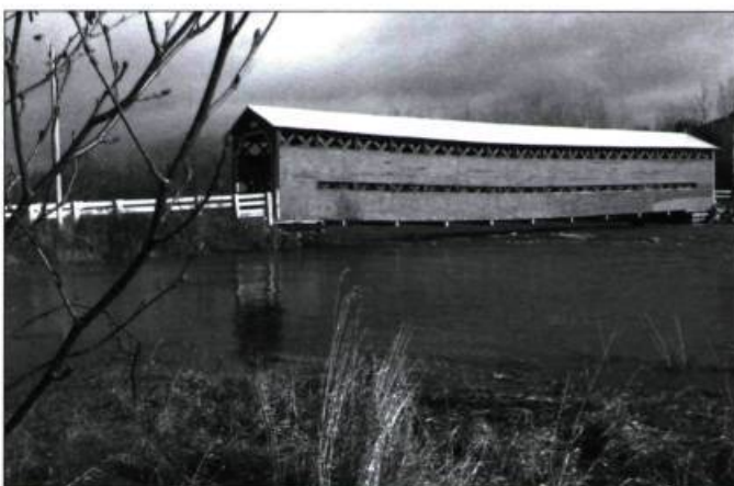
Le pont Heppell, à Causapschal, fête ses 100 ans en 2009.

Afin de diffuser les photographies des jeunes Québécois qui ont été lauréats ou ont reçu une mention au concours L'Expérience photographique du patrimoine, le Conseil des monuments et sites du Québec a réalisé quatre modules d'exposition itinérante qui circuleront dans les bibliothèques du Québec. La cinquantaine d'œuvres datant de 2002 à 2008 offrent un vaste panorama du patrimoine vu par des jeunes de 12 à 18 ans. L'exposition remporte un vif succès : le Réseau BIBLIO de la Capitale-Nationale et de Chaudière-Appalaches ainsi que le Réseau des bibliothèques publiques du Québec ont déjà emprunté ou réservé des modules. Cette nouvelle visibilité pour nos jeunes photographes permettra de sensibiliser les Québécois à leur patrimoine local et d'intéresser de nouveaux joueurs au concours d'envergure internationale. Info : 418 647-4347 ou www.cmsq.qc.ca