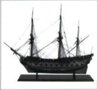
Navire de guerre à 50 canons.

navire, du quai d'embarquement à la cabine du capitaine, en passant par la cuisine, le coin des hommes, celui du chirurgien-apothicaire, l'arsenal, la proue et le gibet, on découvrira quelque 150 objets témoignant de la vie de ces hors-la-loi des mers : vaiselle d'étain, instruments de navigation, armes, figures de proue, coffre de corsaires, etc. Ce faisant, on pourra en apprendre davantage sur tout un panthéon de pirates célèbres ou sur la mutinerie du Saladin, cas illustre au Canada. Jusqu'au 3 janvier 2010. Montréal. Info : 514 872-9150 ou www.pacmusée.qc.ca