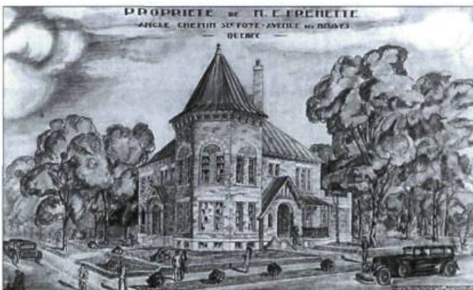
La maison Frenette.