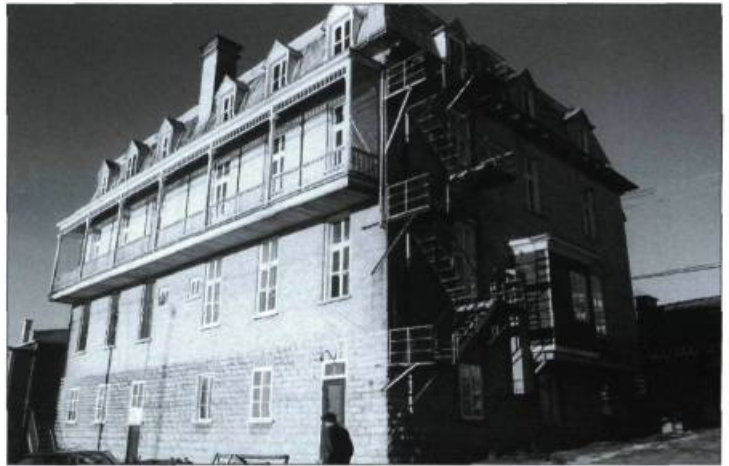
Le Vieux-Couvent de Château-Richer.

L'annonce du nouveau projet réjouit donc le CMSQ, d'autant plus que ce projet est extrêmement significatif pour le milieu. En effet, la bibliothèque constitue un nouvel équipement public pour les citoyens de Château-Richer, tandis que le Centre d'interprétation permettra de consolider le développement récréotouris-