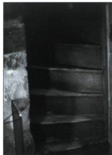
À la déroboée, l'escalier de la maison Poirier garde les traces de ses occupations successives.

Difficile de mesurer l'impact d'une telle action, concède Marie Bachand. Elle affirme tout de même sentir une fierté nouvelle, un plus grand respect du patrimoine dans la population. La municipalité la consulte de plus en plus sur les