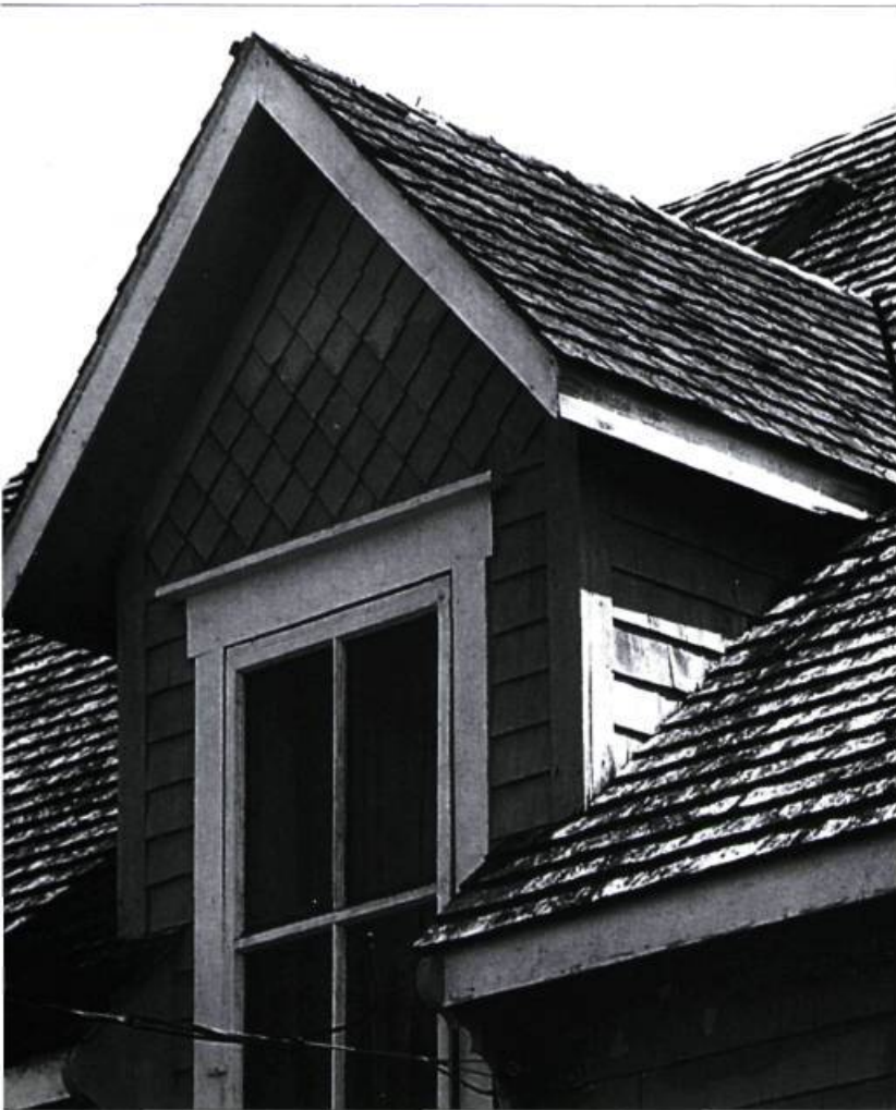
Aspect général d'un pan de toiture exposé au soleil : la surface extérieure des bardeaux mal taillés sèche plus rapidement, et ces derniers se courbent.