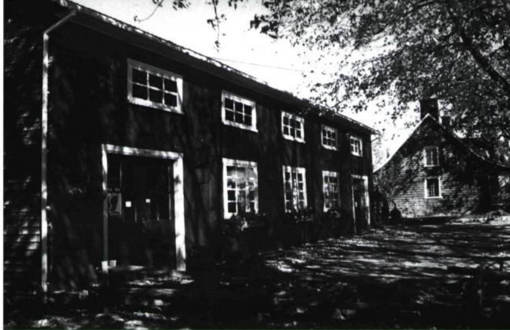
Les visiteurs sont sensibles au « charme rustique » de l'île. Le Jardin des Arts, situé à Saint-Laurent, occupe le site de l'ancienne menuiserie Coulombe.