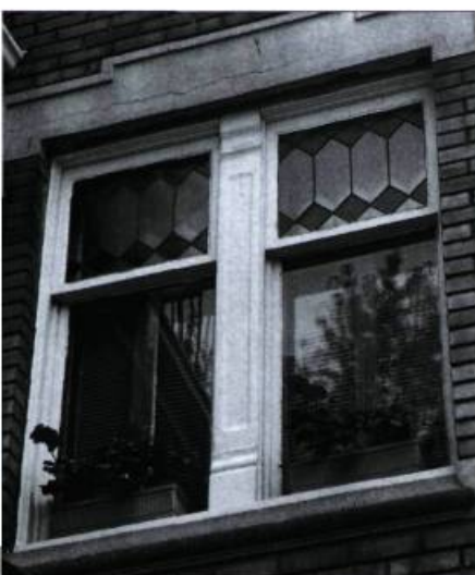
Motifs géométriques typiques de l'influence du mouvement « Prairies » vers la fin de la période de production du vitrail.

Le vitrail se caractérise par une composition de pièces de verre clair ou coloré assemblées à l'aide de fines membrures structurales de plomb où du mastic tient lieu de liant. Cet ensemble de « verres plombés » intégré dans un cadre structural est maintenu d'aplomb grâce à une armature de pièces verticales et horizontales : les vergettes et les barlotières.