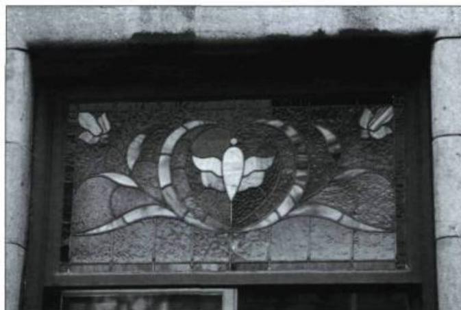
Beau vitrail de style Art nouveau aux lignes courbes avec des accents de verre opalescent.

dait les lieux propices aux manifestations mystiques. Tout au long de ces siècles et de ceux qui suivront, les bâtisseurs d'églises pareront les ouvertures de grandes cloisons translucides, réalisant des mosaïques de verre