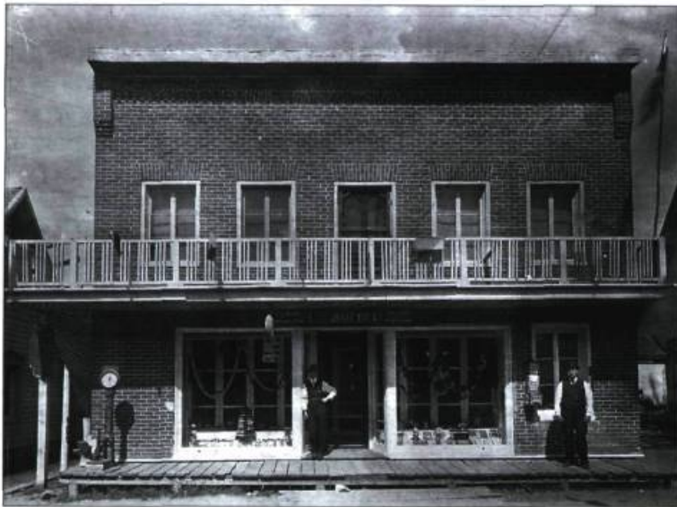
La vocation commerciale de la rue Saint-Jean-Baptiste s'affirme dès le XIX e siècle comme en témoigne l'édifice du magasin Urban-Bolduc.