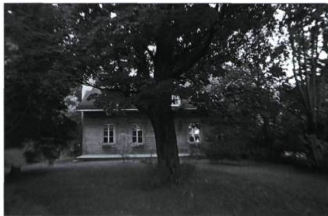
La maison du peintre René Richard, connue sous le nom du domaine Cimon, est située sur la rue Saint-Jean-Baptiste. Elle a été classée monument historique en 1977 ; on l'a voit ici de derrière.

Les paysages de Baie-Saint-Paul ont nourri l'imaginaire de tous ces peintres. C'est avec une grande virtuosité que Clarence Gagnon, par exemple, traduit sur la toile la somptuosité des paysages dans lesquels s'inscrivent harmonieusement les