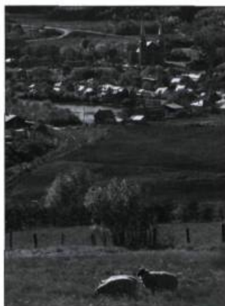
La campagne environnante de Baie-Saint-Paul respire le calme et la sérénité, comme on peut le constater dans cette scène toute pastorale.