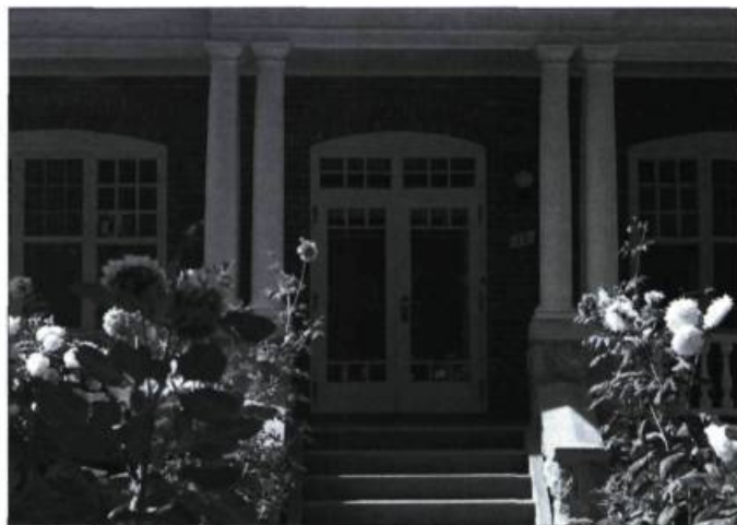
Sur la rue Ambroise-Fafard, face au couvent, on retrouve deux maisons d'inspiration victorienne fort cossues. On remarque ci-dessus la qualité de finition des ouvertures de l'une d'elles.

Plus que jamais, Baie-Saint-Paul est une ville d'art. L'élan donné par Clarence Gagnon a permis à la ville d'envisager un avenir artistique prometteur. Le Symposium de la jeune peinture au Canada qui se