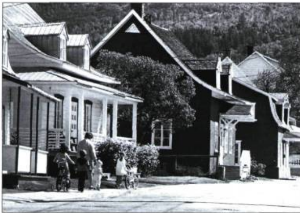
La rue Saint-Joseph conserve son homogénéité architecturale du XIX e siècle. Ici, deux maisons à toit à deux versants et une au toit à la mansarde.

Si certains édifices anciens de la rue Saint-Jean-Baptiste existent toujours et conservent leur vocation