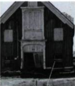
La grange construite vers 1855 est restaurée par « La Claude » Gagnon en 1991