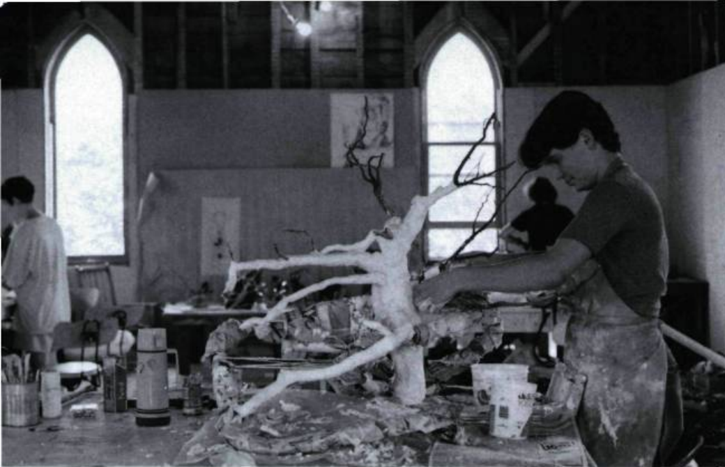
L'église méthodiste de Dunham est devenue en 1988 un lieu de travail pour les artistes. Ci-contre un atelier de sculpture.