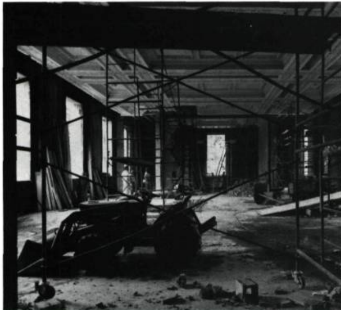
Restauration de la salle no 3 du Musée du Québec.

Le musée du Québec a dû entreprendre d'importants travaux de rénovation en raison de graves problèmes structureux, qui se faisaient de plus en plus menaçants pour la sécurité du personnel et des oeuvres d'art. Le CMSQ reconnaît et encourage l'effort déployé pour respecter l'intégrité du bâtiment, en lui restituant, entre autres, des plafonds richement moulurés, inspirés des plafonds d'origine. Toutefois, il regrette que l'amélioration des qualités muséologiques du bâtiment construit en 1933 ait entraîné la disparition de l'élégant escalier qui dominait l'entrée de l'aile nord ainsi que celle des mezzanines des salles du rez-de-chaussée.