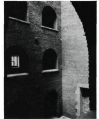
La cour intérieure de la prison des Plaines. «Le respect des divisions intérieures originales de la prison est impératif.»

qui apportent leur aide financière à cette construction de condominiums, vont à l'encontre de leur propre politique de conservation et de mise en valeur de l'architecture ancienne; cela est d'autant plus grave que les démolitions ont lieu à l'intérieur d'un arrondissement historique. Les deux paliers gouvernementaux ont privilégié une rentabilité maximum au détriment du patrimoine; ils ont donc failli à leur devoir de protecteur de notre héritage immobilier, sans compter qu'ils fournissent des armes à l'entreprise privée, qui ne se gênera pas pour les citer en exemple lorsqu'elle voudra agir dans ce sens. ■