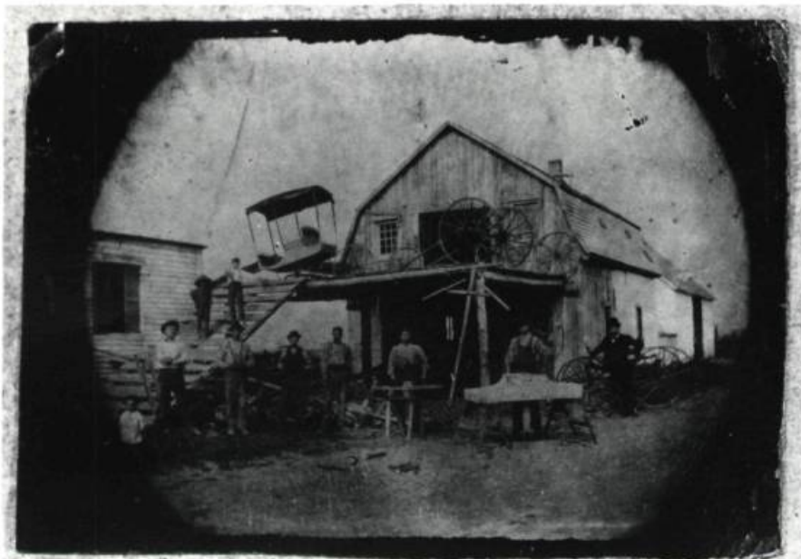
Atelier de voiturier au sud de Montréal vers 1890. Ferrotypes (12,6 x 17,8 cm) réalisés par un artiste inconnu, probablement un photographe itinérant. En 1870, les plaques en tôle brune remplacent les plaques en tôle noire. En 1885, on passe du ferrotypes au collodion au ferrotypes au gélatino-bromure, qui sera utilisé jusqu'en 1930.

piers salés obtenus de calotypes: portraits, paysages, vues de ville, reproductions de dessins.