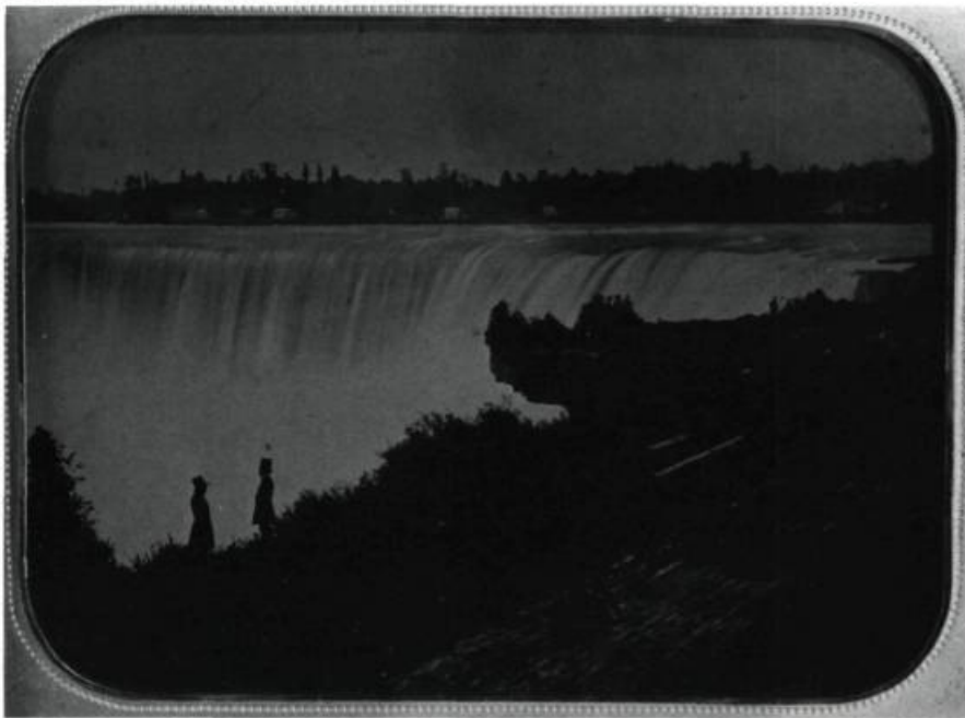
Deux Québécois aux chutes Niagara en juillet 1857. Positif sur verre au collodion en demi-plaque. Artiste inconnu. Un négatif sur verre au collodion développé plus «légèrement» devient un positif une fois placé devant un fond noir.