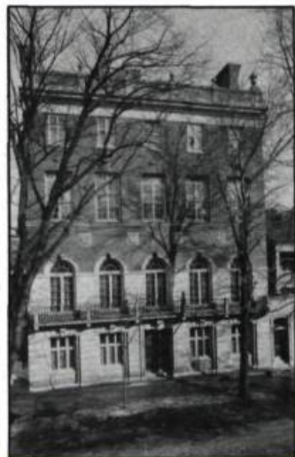
Le University Club, sur la rue Mansfield à Montréal.

Le Conseil des monuments et sites du Québec souhaite que les nombreux projets de réutilisations de cette usine portent fruit. La Dominion Textile constitue un riche exemple, à la fois sur les plans humain, architectural et environnemental, de l'activité industrielle au Québec. Peu connue du public, méconnue des autorités, l'architecture industrielle est l'enfant pauvre du patrimoine québécois. Il est grand temps de corriger cette carence et de mettre en valeur cet héritage. ■