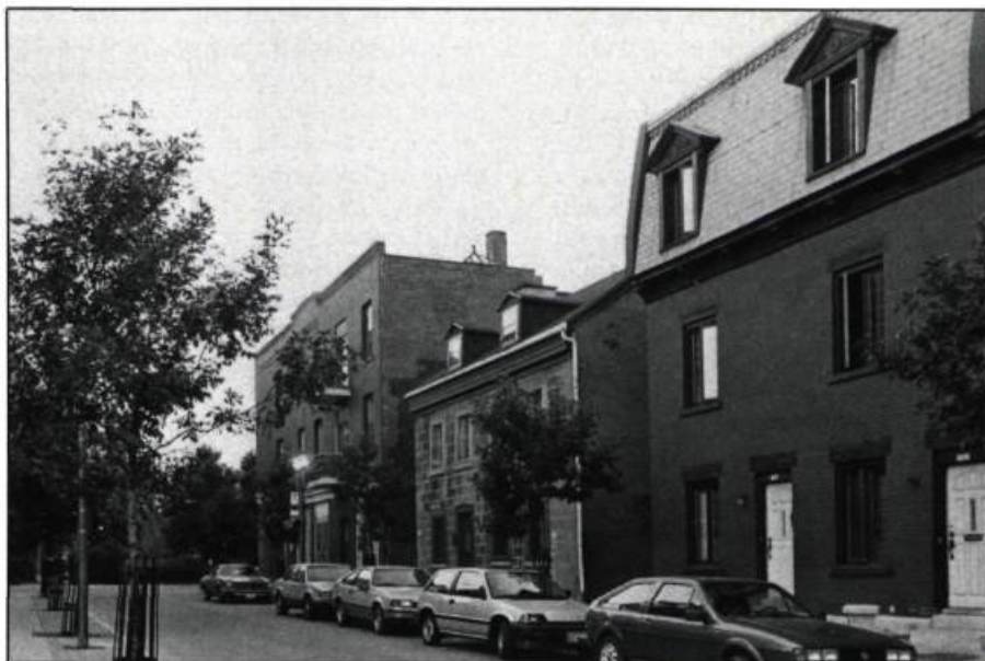
À Montréal, l'aménagement de la petite rue Sainte-Rose, sans exclure l'automobile, affirme et protège le caractère résidentiel du vieux quartier Sainte-Marie menacé par son envahissant voisin, Radio-Canada.

C'est tout autant à partir de l'«existant» qu'on pense la revitalisation ou la relance des artères commerciales. La politique urbanistique et les programmes de subventions ad hoc sont sans doute pour beaucoup dans ce nouvel exercice, dont la mode atteint les petites villes comme les grandes. Cette mode vient d'ailleurs à point, après trente ans de prolifération des centres commerciaux. La qualité des réalisations laisse parfois à désirer, mais au moins on est revenu à la boutique sur rue. Le piéton «urbain», la foule des trottoirs y trouve son compte, et le contact avec la ville s'en trouve d'autant valorisé. Le type de commerce que ces rues réaménagées retiennent ou attirent a aussi le mérite de demeurer d'échelle modeste et de ne pas produire de discontinuités aberrantes dans le tissu des quartiers. La diversité de l'activité, y compris de l'activité artisanale, est favorisée par la variété des locaux, par la structure diversifiée de la propriété et par les disparités de loyer. Ce type d'opération, qui a des effets positifs indéniables sur la conservation active des quartiers traditionnels, se traduit souvent par une conservation douteuse de la qualité historique de certains édifices. À force d'élargir et