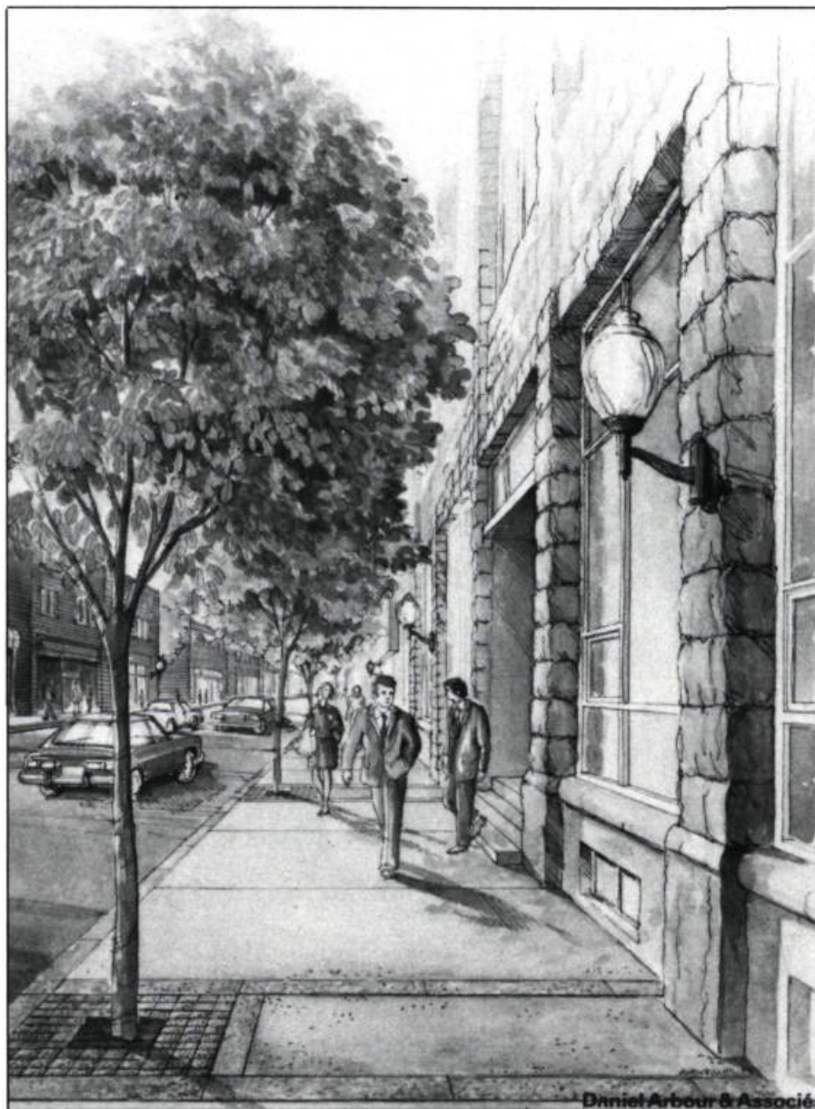
Projet d'aménagement de la rue commerciale Hériot, à Drummondville par Daniel Arbour et Associés. Le retour du piéton «urbain» et de la boutique sur rue. Ici, les trottoirs de béton sont rythmés par deux bandes de granite qui marquent l'implantation des arbres.

L'urbanisme d'après la dernière guerre, qu'il soit moderniste ou pavillonnaire, délibéré ou improvisé, a un seul fondement: la condamnation de la ville traditionnelle. Moderniste, il la démolit, et y substitue ses géométries de tours et de barres. Pavillonnaire, il la fait dépérir en la délaissant. Dans les deux cas, l'automobile peut triompher et le piéton est ignoré. En Amérique, c'est la deuxième formule qui a prévalu. On lui doit l'étalement urbain, la multiplication des centres commerciaux, la zone industrielle et l'autoroute urbaine. Pendant que se bâtissait ainsi la «ville à la campagne», l'urbanisme progressiste appliquait à la ville centrale sa médecine favorite: l'amputation des quartiers populaires et, sous le nom de rénovation urbaine, leur remplacement par d'imposantes prothèses, les «ensembles» de logements publics (HLM). La rénovation urbaine a ici