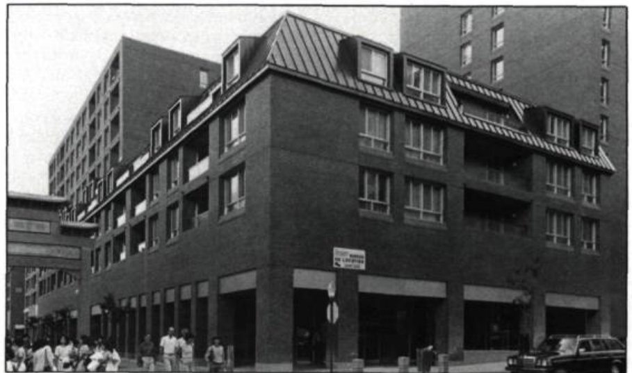
Le zonage négocié a su «inspirer» au complexe Guy-Favreau des formes extérieures conciliantes avec la rue (arcades, étage supérieurs en retrait, fenestration traditionnelle, etc.) ainsi qu'un jardin intérieur autour duquel cohabitent assez bien logements et locaux administratifs.

C'est un peu dans cet esprit que l'idée de réappropriation, non plus seulement des centres historiques proprement dits, mais aussi des quartiers anciens, est sortie des scénarios spécialisés de défense et de restauration du patrimoine, pour passer dans l'urbanisme quotidien. C'est par le biais de nouvelles pratiques, comme les tentatives de revitalisation des artères commerciales ou les divers programmes d'interprétation en quartiers anciens et de consolidation du tissu résidentiel, que s'est concrétisée la notion si prisée par nos hommes politiques montréalais de «regénérescence de la ville traditionnelle». L'opération PIQA (programme d'intervention en quartiers anciens), lancée par la Ville de Montréal en 1979, est à cet égard exemplaire. Elle vise une requalification de l'espace public au moyen d'interventions ponctuelles attrayantes (jardins publics, assainissement des ruelles,