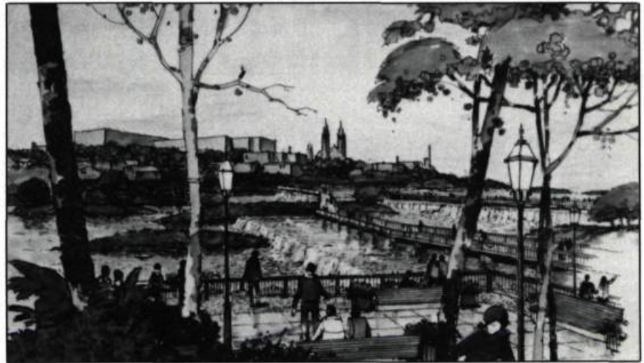
Une première phase de la revitalisation du centre-ville de Beauharnois, débute à l'automne 1985. Dans un deuxième temps, un parc sera aménagé en bordure des chutes de la Rivière Saint-Louis. L'ouverture sur les plans d'eau (fleuve, rivière, lac) redevient une priorité.

En terminant, il convient de s'interroger sérieusement sur les enjeux et sur les significations de ces nouvelles tendances. S'agit-il simplement de pragmatisme opportuniste porté par un contexte de crise, profitant d'un temps d'arrêt dans le mouvement séculaire du progrès technologique?