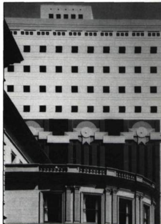
Deux façons différentes de traiter le vocabulaire architectural classique: au premier plan, l'Hôtel de ville de Portland (1895), de style Beaux-Arts, derrière, le côté ouest du Portland Building de Michael Graves (1982).

L'Italie, où construire est une seconde nature, offre le milieu le plus riche d'idées, car l'architecture italienne ne s'est pas coupée du monde intellectuel. Au contraire, elle est au centre des débats politiques et artistiques, que soutiennent une dizaine de revues. Elle se nourrit de l'histoire et de la philosophie autant que de la pratique. Déjà en 1957, la Torre Velasca allie historicisme et modernisme dans une réalisation polémique. Mais ce sont surtout des travaux d'historiens de l'architecture portant sur la structure de la ville ancienne, sur sa genèse et sur l'évolution des bâtiments qui vont mettre à jour la morphologie urbaine et la typologie de l'habitat. Ces connaissances servent dès lors de matériaux conceptuels: les nouveaux ensembles sont conçus à partir de formes et de grou-