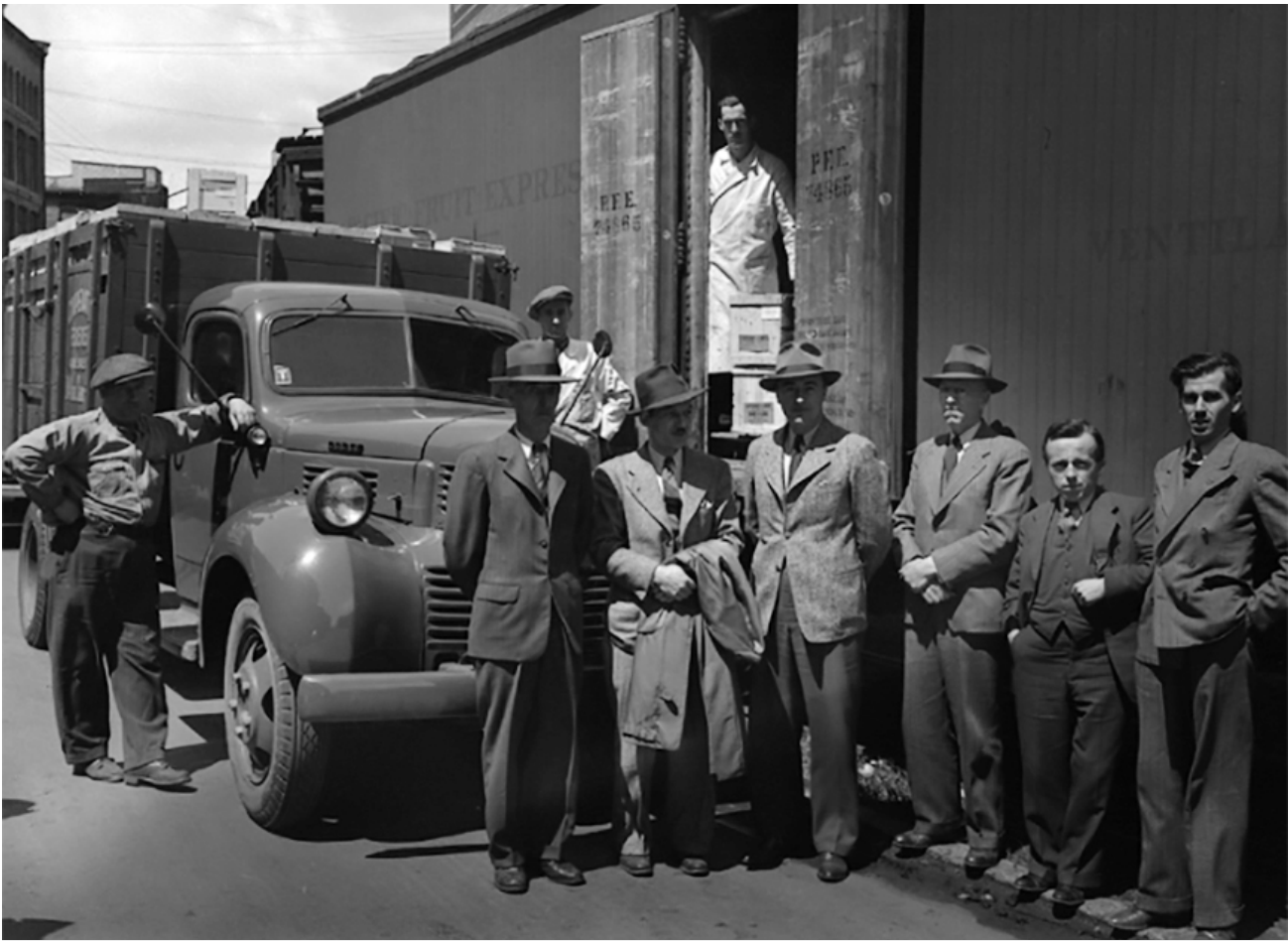
Chargement du 50 e wagon d'œufs à destination de l'Angleterre par la coopérative de Québec, Neuville Bazin, 1944. Q, E6, S7, SS1, P19798.

un bon bagage de connaissances sur les coopératives. Certains évoluent dans le monde coopératif québécois depuis bon nombre d'années; d'autres ont étudié l'organisation et le fonctionnement des coopératives en Europe dans le cadre d'une formation universitaire, de travaux de recherche ou d'une mission gouvernementale.