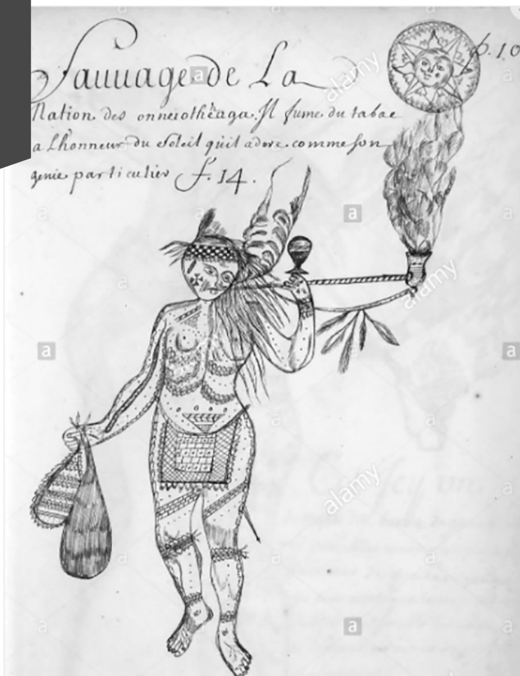
Dessin du Codex

Louis Nicolas a représenté des Autochtones dans des scènes de la vie quotidienne. Il a utilisé pour cela ses souvenirs et des gravures disponibles dans les bibliothèques qu'il a fréquentées. Ici, la légende indique qu'il s'agit d'« un sauvage de la nation des onneithéaga. Il fume du tabac à l'honneur du soleil qu'il adore comme son génie particulier ». (Alamy Stock Photo).