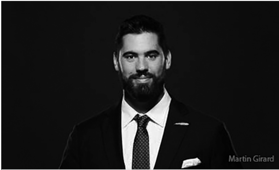
Laurent Duvernay-Tardif.