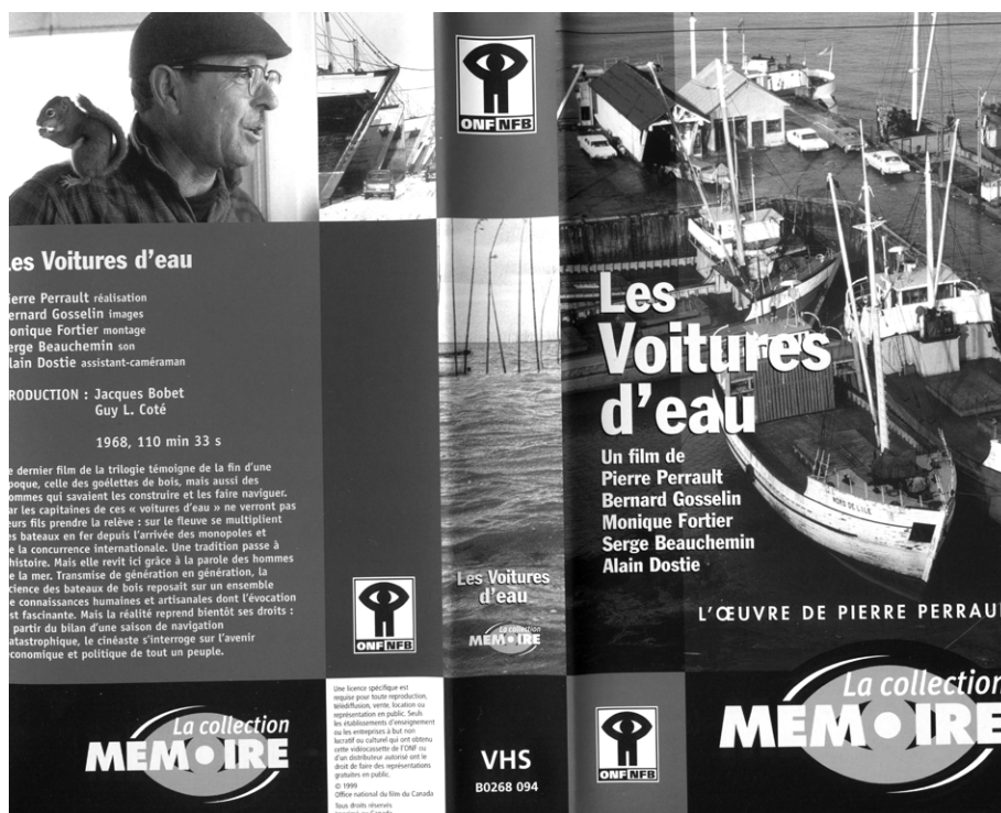
Jaquette de la vidéocassette du film Les voitures d'eau , de Pierre Perrault (réédition de 1999). Production et distribution de l'Office national du film du Canada. Après avoir été distribués en 16 mm et avant leur commercialisation en DVD, les films de Pierre Perrault ont été repris en format VHS, individuellement et en coffrets, dans la collection « Mémoire ». (Reproduit avec l'autorisation de l'Office national du film du Canada).

Sorti au début de 1969 après quasiment trois années de tournage, Les voitures d'eau de Pierre Perrault (1927-1999) demeure le film le moins connu de sa fameuse « trilogie de l'Île-aux-Coudres » qui débutait avec Pour la suite du monde (1963) et se poursuivait avec Le règne du jour (1966). Et pourtant, un demi-siècle après sa sortie et vingt ans après la disparition du cinéaste, on constate qu'à lui seul, ce dernier titre de la trilogie encapsulait une partie de la mémoire de la construction des goélettes de bois sur l'île aux Coudres en montrant un passé désormais révolu. De plus, Les voitures d'eau témoigne dramatiquement de la fin d'une époque : la disparition annoncée d'une forme de navigation fluviale, mais aussi d'un savoir-faire lié au travail du bois selon des procédés qui s'étaient transmis de génération en génération. Des dimensions historiques, ethnologiques, culturelles, patrimoniales et politiques y sont également présentes. Et comme l'écrit notre meilleur historien du cinéma québécois – le professeur Yves Lever – sur son site Internet, le film Les voitures d'eau reste indissociable du contexte de la Révolution tranquille, car certains des dialogues abordent en filigrane des thèmes comme la moder-