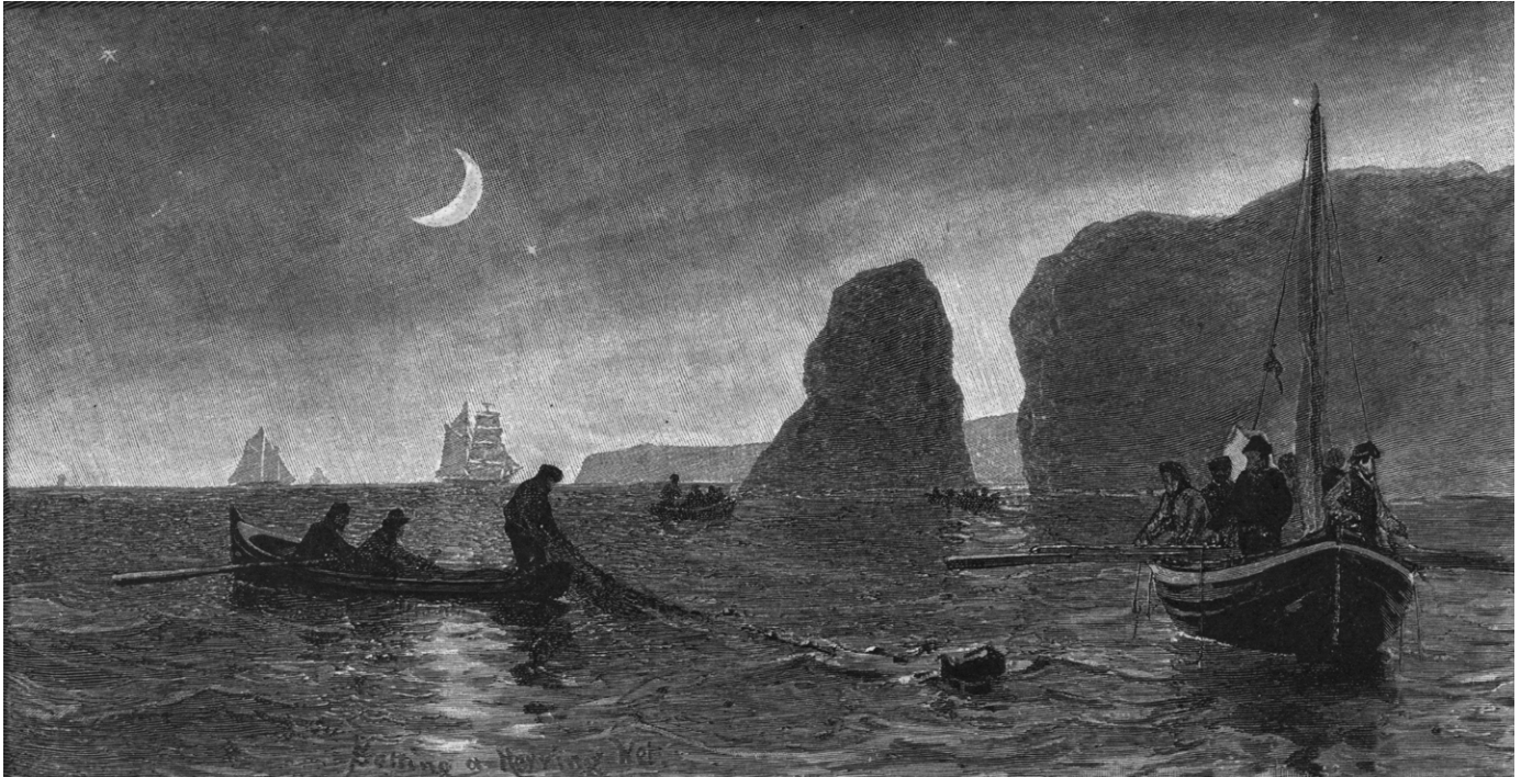
Gravure représentant des pêcheurs relevant des filets remplis d'appâts nécessaires à la pêche à la morue, 1882. (Musée de la Gaspésie. Collection Richard Gauthier. P162/5).