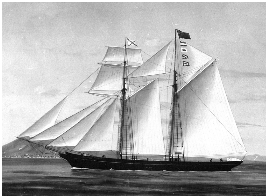
Peinture représentant la goélette Flying Fish du capitaine John T. Ahier, originaire de l'île de Jersey. (Musée de la Gaspésie. Série Phyllis R. Mckie, P57/8, 81.13).

Les solidarités locales sont également primordiales lorsque vient le temps pour les entrepreneurs de trouver un ou des associés. Par exemple, dans des régions comme la Côte-de-Gaspé, le