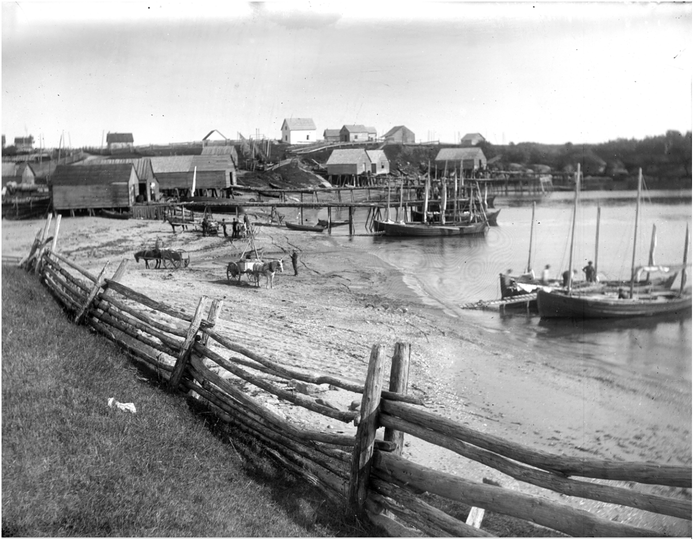
Négatif sur verre représentant les installations du poste de pêche de Belle-Anse [entre 1890 et 1910].

diverses échelles, des contraintes de leur milieu.