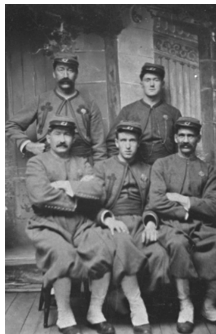
Groupe de zouaves, vers 1870. (Ferrotype).

Ce qui n'aide pas la cause des premiers habitants de Piopolis, c'est que les terres de l'endroit sont très rocheuses. En outre, les meilleurs emplacements agricoles ont été accaparés par des spéculateurs qui ont pris des lots près des cours d'eau et du lac, sans les occuper et sans les défricher – attendant simplement que les prix augmentent grâce au travail des colons pour les vendre. Les terres qui restent à donner se situent loin des routes, difficiles