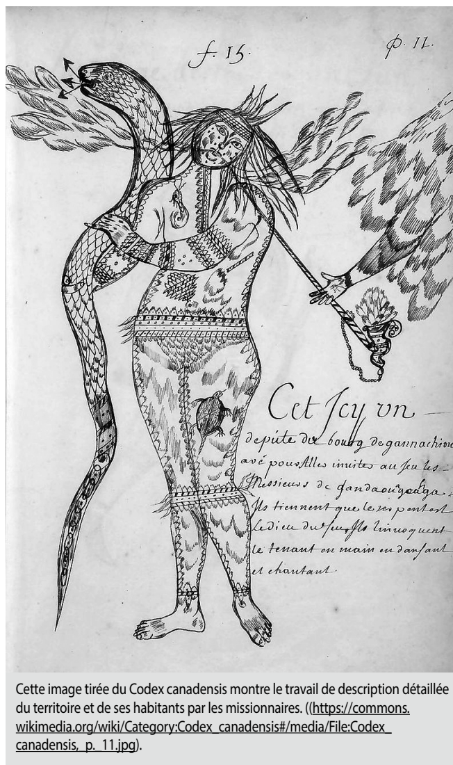
Cette image tirée du Codex canadensis montre le travail de description détaillée du territoire et de ses habitants par les missionnaires.

Au contraire, si plusieurs reconnaissent aujourd'hui les impacts dévastateurs de la colonisation pour les autochtones, l'histoire peut nous enseigner que ces impacts n'ont pas nécessairement été motivés par les pires intentions. Cette leçon devrait servir de mise en garde à une époque où les bonnes intentions