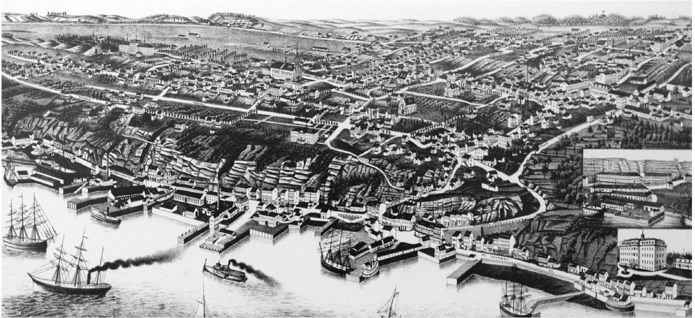
Une vue de Lévis à vol d'oiseau réalisée en 1881.

de Lévis. Au cours de la décennie suivante, il est à l'Assemblée législative de Québec où il assure la publication des débats parlementaires. Puis, en 1892, il obtient le poste de sténographe français à la Chambre des communes qu'il occupe jusqu'à sa retraite en 1917. À ce parcours qui lui assure un contact permanent avec l'actualité s'ajoute un goût prononcé pour la lecture. « Lecteur assidu et persévérant », selon ses propres mots, Desjardins se constitue, au fil des ans, une vaste bibliothèque couvrant une variété de sujets : l'histoire, la politique, la religion, le droit et l'économie, notamment. Il manifeste un intérêt particulier pour la doctrine sociale de l'Église et pour les écrits du sociologue français Frédéric Le Play. Il adhère, à la fin des années 1890, aux sociétés d'économie sociale parisienne et montréalaise qui propagent les idées de ce dernier.