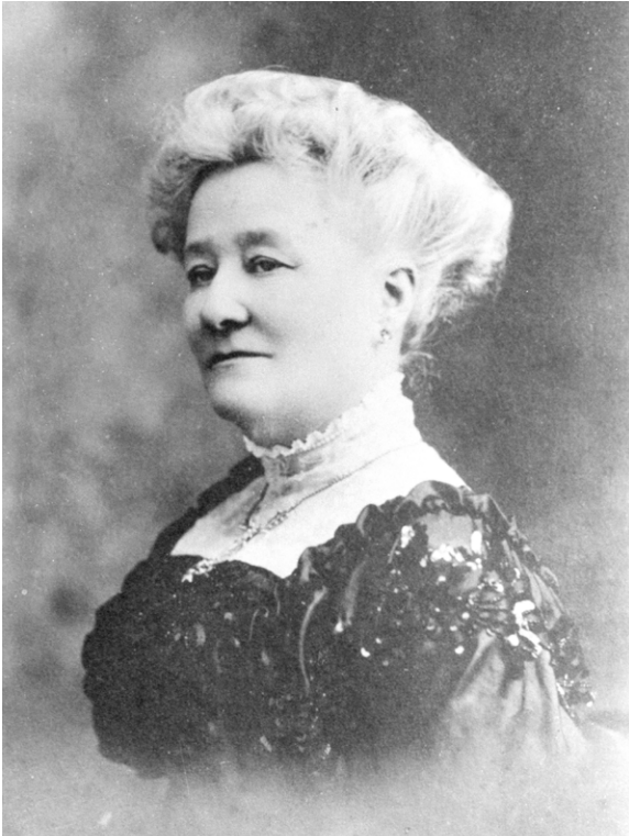
Dorimène Desjardins (1858-1932) est reconnue comme cofondatrice des caisses populaires. Partageant l'idéal social de son mari, Alphonse Desjardins, elle a collaboré étroitement à ses travaux. Elle a entre autres veillé au bon fonctionnement de la Caisse populaire de Lévis pendant ses absences prolongées, en plus de contribuer à la diffusion de ses idées après son décès.

à la fois de foyer d'éducation et de centre d'initiative». Cependant, «l'institution mère», celle qui amorcerait le mouvement, Desjardins l'affirme sans hésitation dans le Mémoire , ce devrait être la caisse populaire.