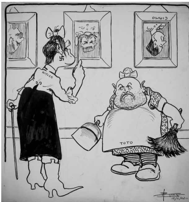
C'est-y au goût de madame, comme ça? « Grand barda au palais de Venise », La Presse, 12 février 1943.

japonais incitant le petit Hitler à crever le pneu d'une voiture représentant la conférence de Bruxelles où l'on cherchait des moyens pacifiques pour mettre fin au conflit entre la Chine et le Japon, éclaté en juillet. Le vêtement du Japonais n'est pas anodin. Il porte une robe japonaise traditionnelle, chausse des sabots à talons et une casquette de militaire, ce qui lui confère un aspect ridicule qui vise à se moquer du Japon impérialiste. Quant à Hitler, il est vêtu d'une salopette de garçon ornée d'une croix gammée. Après l'invasion de la Pologne, en septembre 1939, Hitler parle de possibilité de paix. C'est donc dans un même ordre d'idées qu'Hitler, toujours en gamin habillé d'une salopette, ramène l'oiseau de la paix ensanglanté, un couteau sous l'aisselle, à l'Europe, représentée par une vieille dame : « C'est-y c't'oiseau-là que vous cherchez la mère?