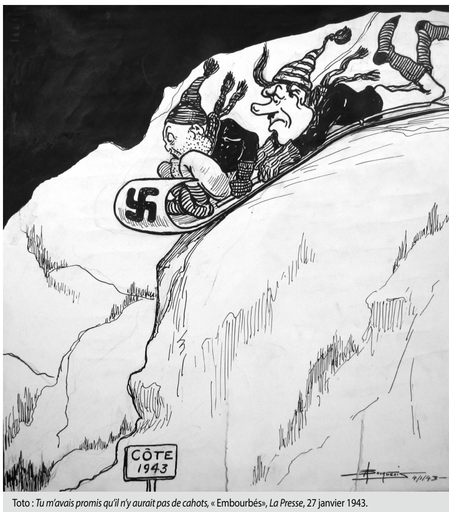
Toto : Tu m'avais promis qu'il n'y aurait pas de cahots, « Embourbés », La Presse , 27 janvier 1943.

Mais qu'en est-il de l'humour et de la caricature de Bourgeois lors de la Seconde Guerre mondiale? La caricature ou le dessin de presse durant les deux guerres mondiales peuvent paraître lourds lorsqu'ils sont utilisés dans un but essentiellement de propagande. Si humour il y a, sa portée s'estompe derrière le message politique et moralisateur cherchant à influencer le lecteur. L'équilibre entre ses différentes expressions n'est pas toujours atteint et c'est souvent le rire qui écope au bout du compte. Or, nous verrons que Bourgeois arrive à traiter du conflit sans verser dans le dessin de