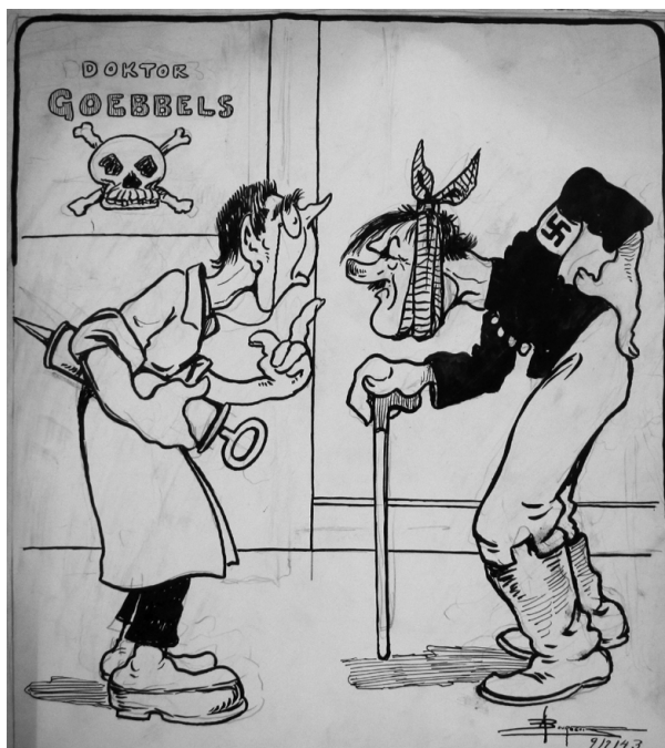
Sauf vot' respect vot' Excellence a dû attraper quelque chose dans la région du "Rhin", « La clinique du docteur Goebbels », La Presse, 9 juillet 1943.

En plus de les dépeindre en petites dames, Bourgeois les présente en tête à tête lors d'un souper amoureux, alors que la résistance, symbolisée par une bombe prête à exploser, menace leur moment intime.