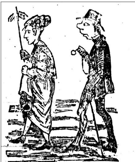
3 me . mois. Il fait une conquête dans le jardin du Fort.

Nemo, « La vie d'étudiant », épisode 5, Le Charivari canadien , 17 juillet 1868.