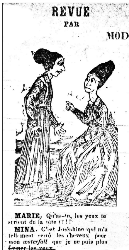
Nemo, « Revue comique », 1 re case, Le Charivari canadien , Québec, 5 juin 1868.

Dans la Revue comique , deux belles conversent entre elles. Elles sont identifiées par leur nom, Marie et Mina, ce qui est assez rare, nous le verrons par la suite, et devisent à propos de leurs coiffures réciproques. Le comique de la scène est dû aux propos excessifs. Ce courant de blagues sur la mode s'inspire sans doute de collections de caricatures misogynes ridiculisant « la toilette » des dames, qui circulaient en France au début du XIX e siècle sous le titre de « Le bon genre ».