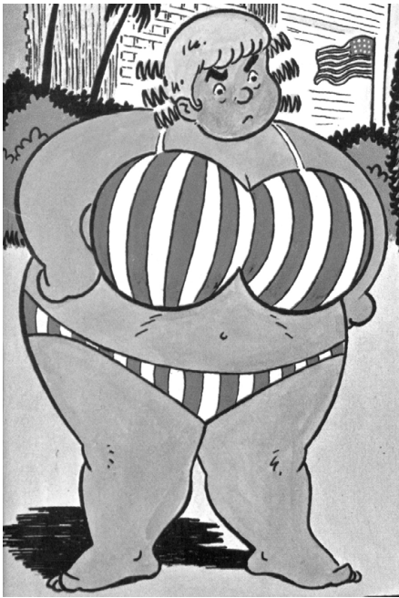
Zénoïde, Page couverture, Onésime, les aventures d'un Québécois typique , Montréal, L'Aurore, 1975.

femme. Lorsque Baptiste ou Onésime sont représentés sans leur femme, ils sont à l'extérieur de leur maison. L'intérieur des maisons est donc au cœur de la vie des femmes, ce qui semble tout à fait dans la logique du fait que les femmes étaient avant tout des ménagères. Mais l'amalgame épouse-foyer a aussi une forte résonance symbolique.