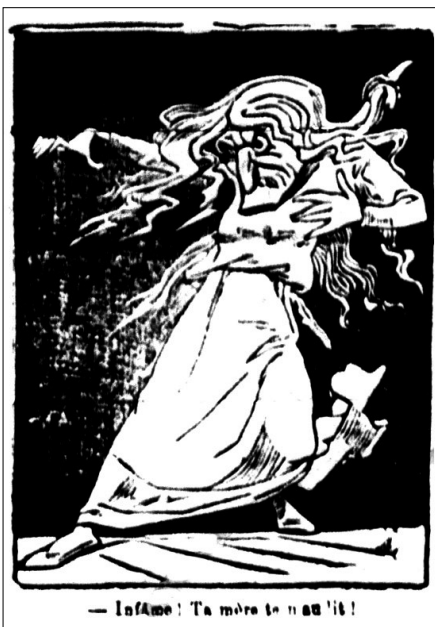
— Infâme ! Ta mère te l'a dit !

le monde du paraître pour ces jeunes graveurs anonymes. Dans le monde de leurs rêves. Ce ne sont pas des femmes de chair, mais des femmes fantasmées. Or, si les lecteurs pouvaient partager les rêves des graveurs, on peut supposer qu'il en allait autrement des lectrices,