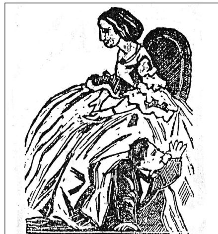
La vignette ci-dessus nous fait voir un de ces individus sous la jupe de sa femme faisant le pied-de-nez à ses créanciers.

Les épouses semblent donc plus délurées que les filles. L'une tenant les cordons de la bourse, l'autre s'amusant de jeux de séduction anodins. On pourrait croire que dans les dessins humoristiques de l'époque, la position de mari