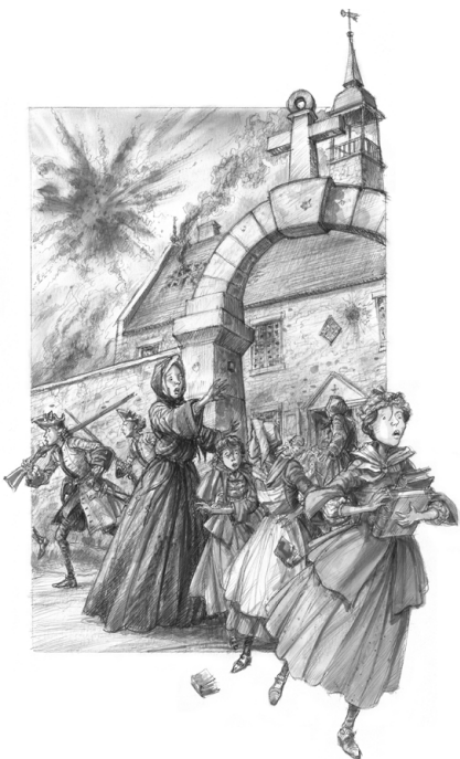
Louisbourg par Francis Back. (©Raphaëlle & Félix Back).

nario-maquette, lui procure en outre une corde supplémentaire à son arc et l'amène à expérimenter une nouvelle profession, celle de l'enseignement, carrière qu'il exercera durant sept années dans une université réputée de Taïwan. Autre legs hérité de la fréquentation des plateaux de tournage, Francis Back retient du cinéma une préoccupation très vive pour la « mise en scène » des images, une dimension émotive qui ajoute à la valeur d'une scène ou d'une évocation picturale, volonté de faire cohabiter l'impératif pédagogique avec l'indispensable ressort imaginaire, la rigueur scientifique et l'expérience ludique. Car la visée première de l'illustrateur, à travers ses dessins, est naturellement d'informer le public, mais en veillant scrupuleusement à faire oublier la lourdeur documentaire et le caractère figé trop souvent accolés aux images historiques. Comme il aimait à le rappeler, l'expérience historique n'est pas une aventure désincarnée : « nos ancêtres étaient pénétrés de la même nature humaine que nous – désir, peur, haine, convoitise, courage, altruisme, générosité... » C'est cette humanité que l'il-