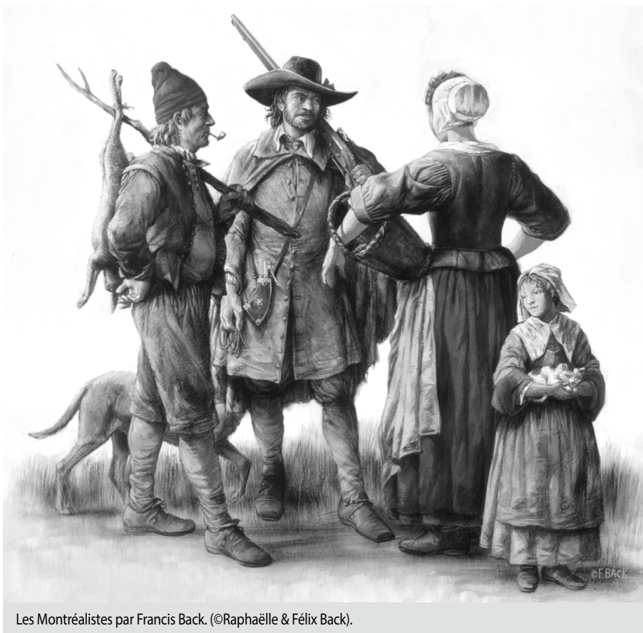
Les Montréalistes par Francis Back. (©Raphaëlle & Félix Back).

À cette expérience artistique, s'ajoute l'incessante et minutieuse fréquentation des sources anciennes et la lecture de la littérature scientifique qui, par leur somme, augmentent les capacités intuitives de Francis Back lorsqu'il aborde un sujet historique. C'est d'ailleurs ce qui rendait son travail si précieux à ceux qui ont eu recours à sa palette afin d'illustrer leurs projets. Certes, l'apport d'Internet et des nouvelles technologies de l'image