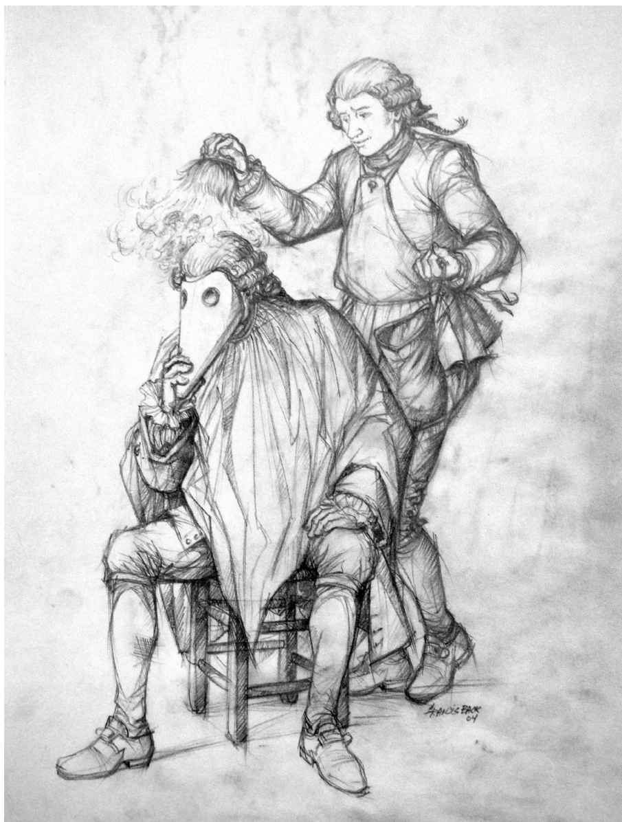
Un coiffeur par Francis Back. (©Raphaëlle & Félix Back).

Une quête identitaire se mêle en partie à ce projet artistique, quête qui l'amène, suivant une démarche empruntant à l'ethnographie, à vouloir mieux saisir les sources originelles qui métissèrent les faits amérindiens et français. Par là, il souhaite également mieux comprendre