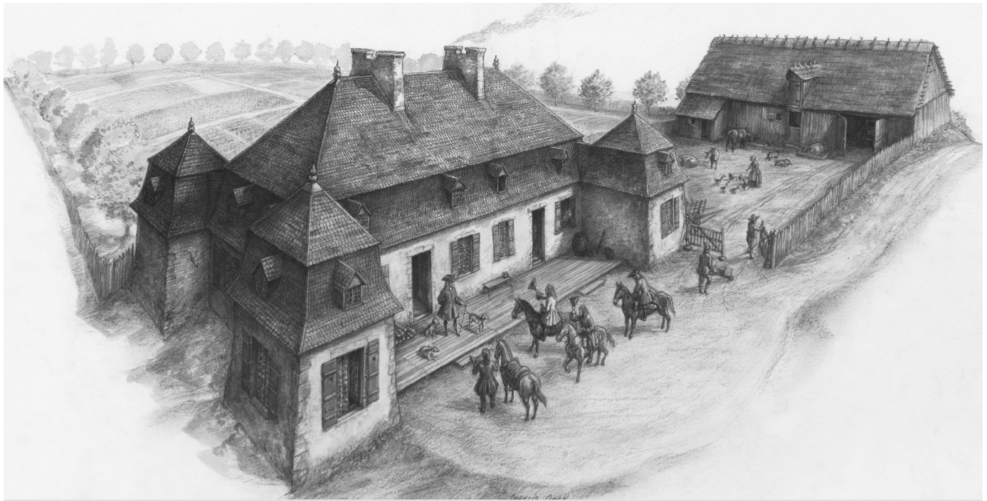
Le château de Callière, Montréal, par Francis Back. (©Raphaëlle & Félix Back).