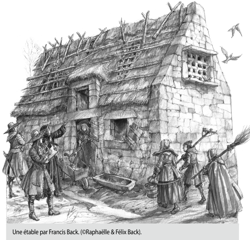
Une étable par Francis Back. (©Raphaëlle & Félix Back).

de représenter des sujets inédits, l'autre étant absorbé par la production sur la planche à dessin.