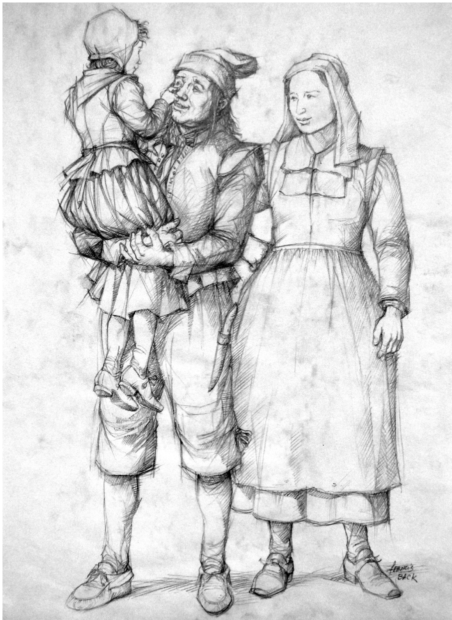
Couple et enfant par Francis Back. (©Raphaëlle & Félix Back).

parmi les ouvrages de référence. L'illustration historique étant une profession relativement récente (elle apparaît sous une forme plus scientifique à la fin du XVIII e siècle avec la venue des encyclopédistes), l'imagerie des siècles passés demeure souvent approximative, anachronique, voire fantaisiste. Outre quelques portraitistes officiels de l'État ou des peintres de l'armée et de la marine qui se consacrent exclusivement à la postérité de l'élite politique et militaire, peu d'artistes s'attachent à décrire