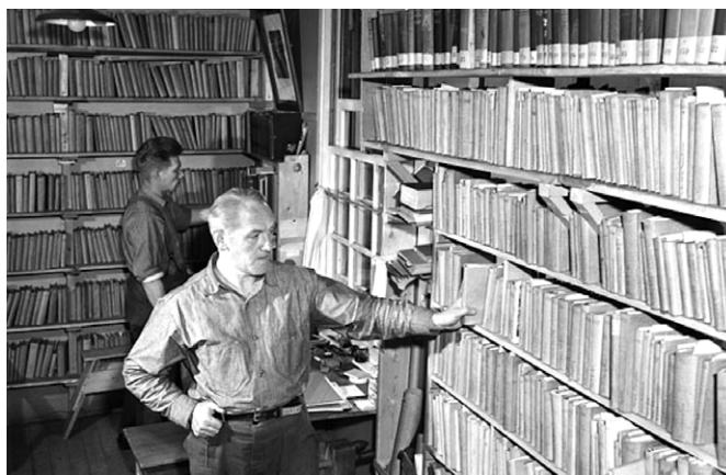
Prisonniers allemands fréquentant la bibliothèque du camp d'internement numéro 42, Sherbrooke, 18 juin 1944..

vers l'Allemagne et peu furent employés au sein des forces d'occupation. Le report de leur rapatriement en raison des difficultés de transports affecta grandement