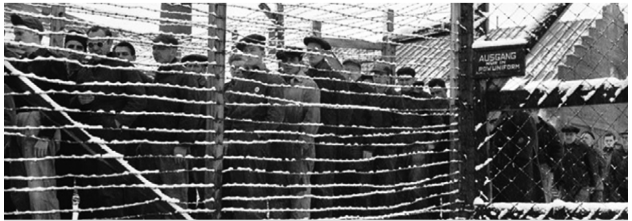
En l'absence de photographies du camp 45 de Sorel, voici des images du camp 42 de Sherbrooke. Prisonniers allemands au camp 42, 23 novembre 1945. Sur l'écriteau rédigé en allemand : « Permission de sortir, mais seulement avec l'uniforme de prisonnier de guerre ». (Bibliothèque et Archives Canada/PA-163788).

Malgré l'ampleur de ces opérations, la détention des militaires allemands au Canada durant la Seconde Guerre mondiale demeure un aspect méconnu de la participation canadienne au conflit. Pourtant, le Canada obtint une position cruciale parmi les Alliés en raison de son implication active dans la captivité des prisonniers de guerre. De plus, les Canadiens entreprirent plusieurs projets expérimentaux à l'endroit des captifs allemands, notamment un programme de dénazification (ou rééducation), bien que cela fut interdit par la Convention de Genève de 1929 relative à la détention de guerre. Les autorités britanniques, canadiennes et américaines tentèrent donc secrètement, à partir de 1944, de dénazifier ces « soldats d'Hitler ». À la suite de la reddition de l'Allemagne, en mai 1945, les puissances alliées intensifièrent leurs efforts en ce sens. Dans ce contexte, le gouvernement canadien ouvrit le camp 45 à Sorel. Entre juin 1945 et avril 1946, ce site servit de laboratoire pour un programme avancé de rééducation. Non seulement on y forma