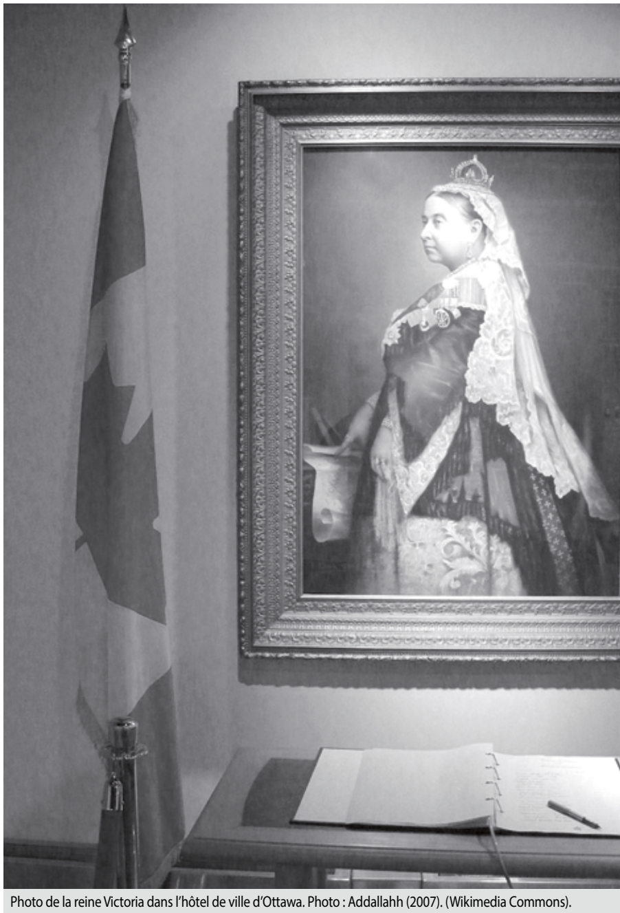
Photo de la reine Victoria dans l'hôtel de ville d'Ottawa.

Aujourd'hui, à l'intérieur de la fédération canadienne, les provinces jouissent, sur le plan juridique, d'une souveraineté véritable dans l'exercice de leurs compétences constitutionnelles. Elles disposent de pouvoirs législatifs qui leur sont propres et d'importantes sources de revenus. Toutefois, dans les faits, cette souveraineté doit être relativisée à la lumière d'un certain nombre de facteurs susceptibles de favoriser la centralisation du régime canadien, comme le pouvoir du Parlement de légiférer en matière d'urgence et d'intérêt national, le pouvoir de ce même parlement de soumettre à son autorité certains ouvrages ou entreprises de nature