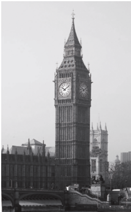
La tour de Big Ben, au palais de Westminster à Londres, vue depuis la Tamise.

locale, la prépondérance des lois fédérales sur les lois provinciales en cas de conflit entre celles-ci, le droit du gouvernement du Canada de dépenser dans les champs provinciaux, la compétence du Parlement à l'égard des matières résiduelles, la possibilité pour le Parlement d'empiéter sur les compétences provinciales, notamment par l'utilisation de ses pouvoirs accessoires, la prépondérance fiscale de l'ordre fédéral de gouvernement, le principe voulant que les lois fédérales puissent lier les provinces, mais pas l'inverse, etc.