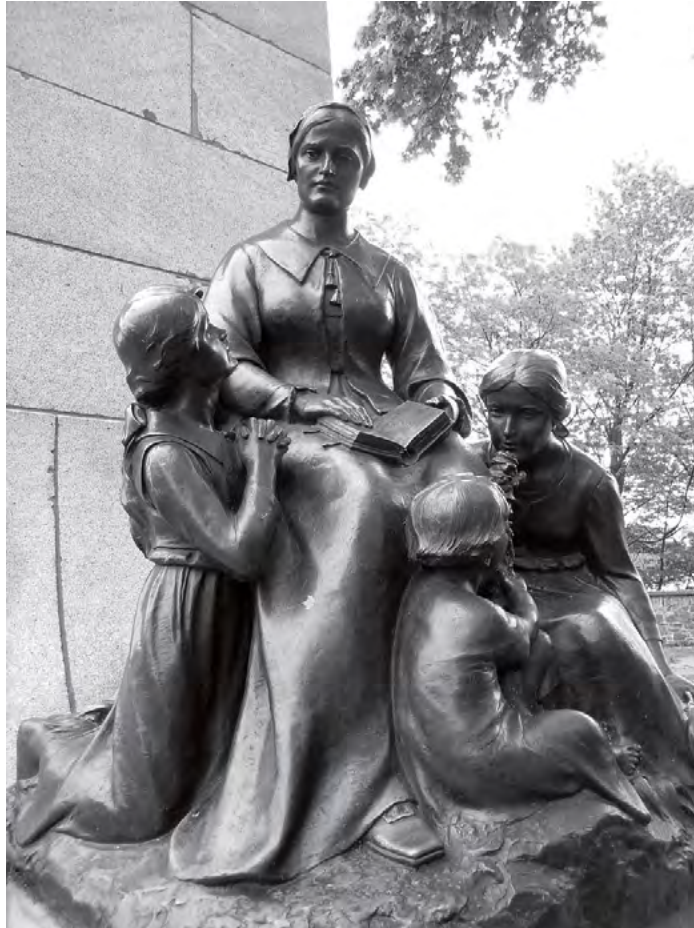
Marie Rollet et ses enfants, représentés par le sculpteur Alfred Laliberté pour le monument de Louis Hébert, à Québec, en 1918.