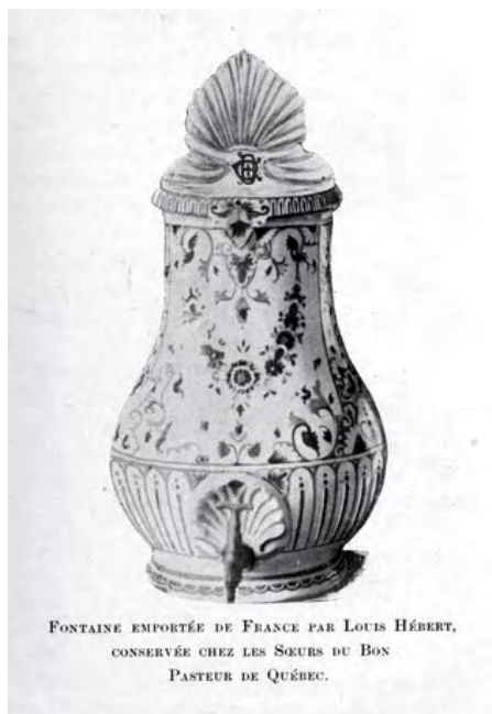
Fontaine emportée de France par Louis Hébert, conservée chez les sœurs du Bon-Pasteur de Québec.

Après un difficile voyage en mer de deux mois, le navire sur lequel Marie et sa famille ont voyagé accoste à Tadoussac le 14 juin. Leur destination finale est Québec, où ils arrivent en juillet. Que fait-elle dans les premiers