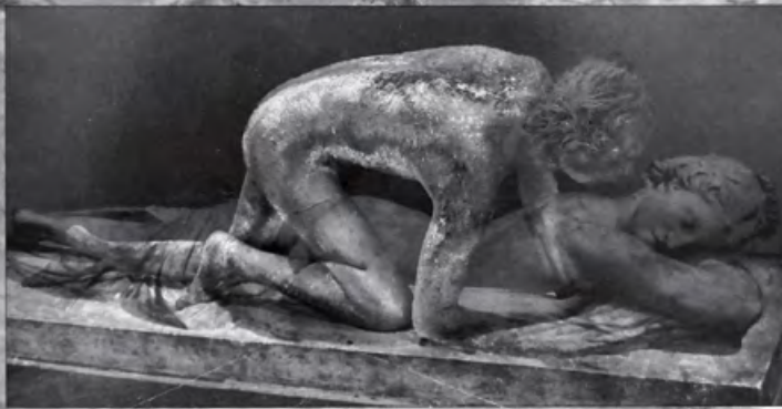
Androgyne. Dernier 33 tours de Jean-Pierre Ferland avant un silence de huit ans sur disque. Jamais réédité en CD. Jaune, PJ-1001, 1984. Ici encore, Ferland était en avance sur son temps et se renouvelait sans cesse.