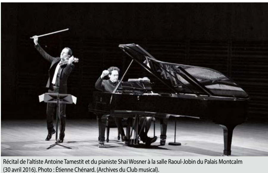
Récital de l'altiste Antoine Tamestit et du pianiste Shai Wosner à la salle Raoul-Jobin du Palais Montcalm (30 avril 2016).

Marie-Thérèse Lefebvre. Chronologie musicale du Québec, 1535-2004 : musique de concert et musique religieuse . Québec, Les éditions du Septentrion, 2009, 366 p.