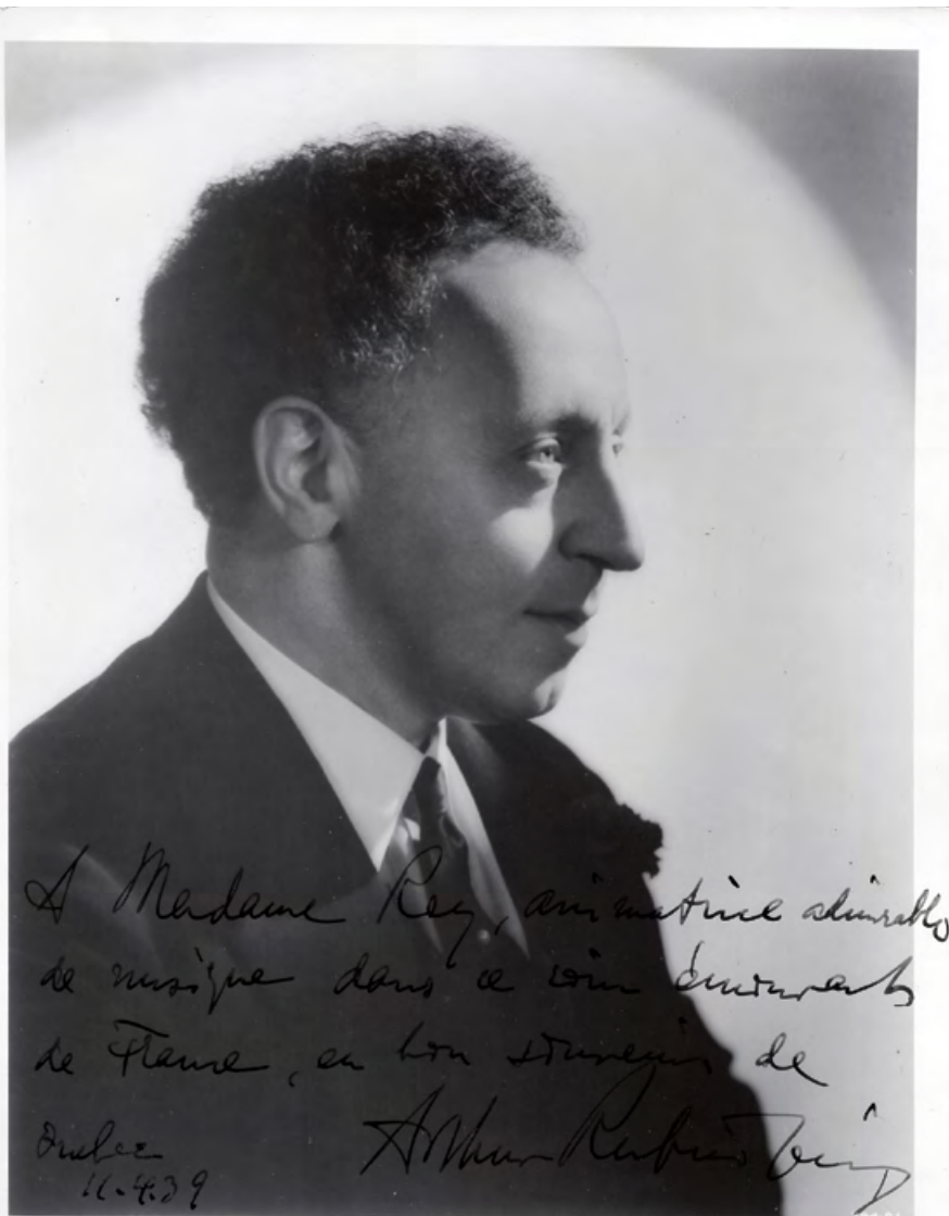
Photo autographiée du pianiste Arthur Rubinstein à l'occasion de son concert du 11 avril 1939.