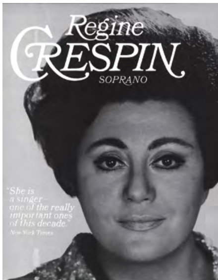
Affiche pour le récital de la soprano Régine Crespin (8 mai 1969).

du nombre d'anglophones au sein de son comité.