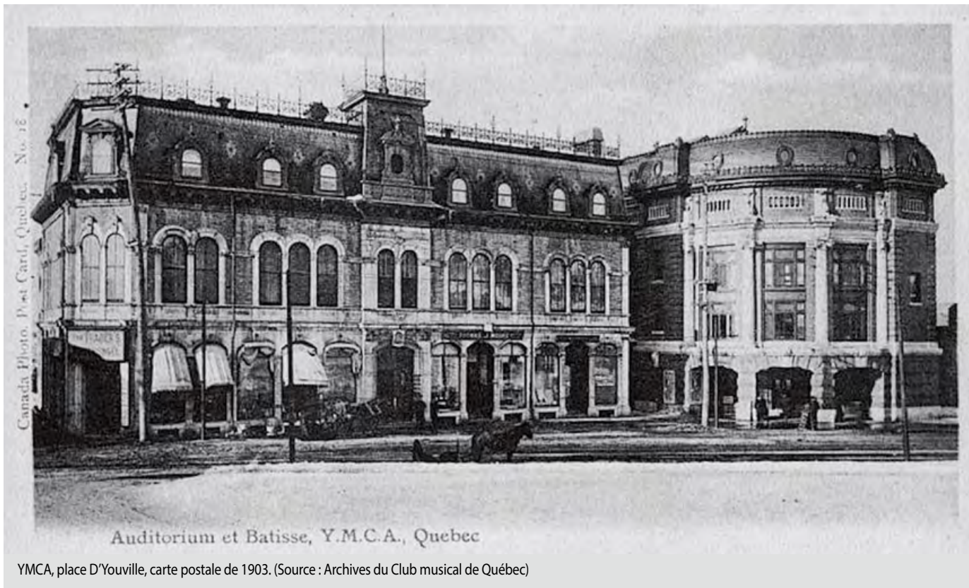
YMCA, place D'Youville, carte postale de 1903.

l'organisation. À cette époque, les magasins et les journaux sont nombreux à permettre au club d'afficher gratuitement les concerts à venir. Pour ce qui est du régime politique, il n'hésite pas à subventionner l'organisation, quel que soit le parti au pouvoir. On voit également des parlementaires éminents comme le premier ministre Louis-Alexandre Taschereau ou le secrétaire de la province de Québec Athanase David accepter de parrainer l'organisme.