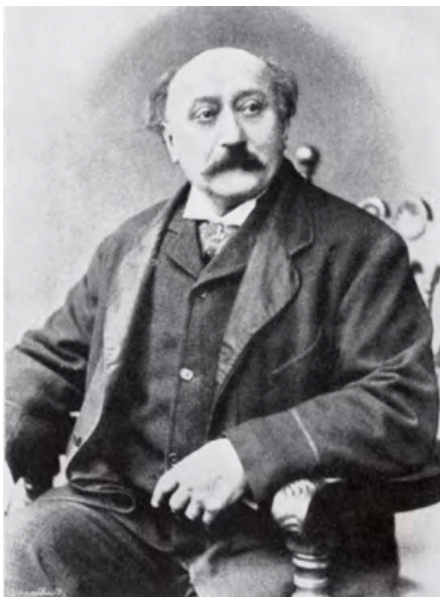
La troupe Arditi entreprend à Montréal, puis à Toronto, une tournée de 14 mois qu'elle poursuit dans 21 villes du Midwest américain, dont certaines entendent de l'opéra pour la première fois. De retour à Montréal du 24 au 29 décembre 1883, Luigi Arditi, à la tête de la troupe de l'Academy of Music de New York, dirige La sonnambula , La traviata , Il trovatore et Lucia di Lammermoor dont il avait donné la première canadienne en 1853. (Luigi Arditi, My Reminiscences , iv).

prendra une saison d'opéra italien de deux semaines au Théâtre Royal, avec un effectif de 40 personnes, chanteurs et musiciens compris! Le répertoire était composé de trois opéras de Donizetti en première canadienne, Lucia di Lammermoor , Lucrezia Borgia et La favorita , en plus de Norma de Bellini, dont on ne connaissait que la version tronquée. Un effectif si maigre pour un répertoire si exigeant? Hum! Pas facile de circuler des deux côtés de la frontière. Vous prenez d'abord un bateau qui emprunte le fleuve Hudson, le lac Champlain et la rivière Richelieu jusqu'à Saint-Jean, puis un train vous conduit à La Prairie et, de là, vous montez sur un vapeur qui vous débarque finalement à Montréal. Dans ces conditions, comment déplacer un personnel important, des décors imposants et une garde-robe élaborée? Pour la première fois, les amateurs entendent de l'opéra italien « authentique ». Le public et la presse applaudissent, mais le chroniqueur de la