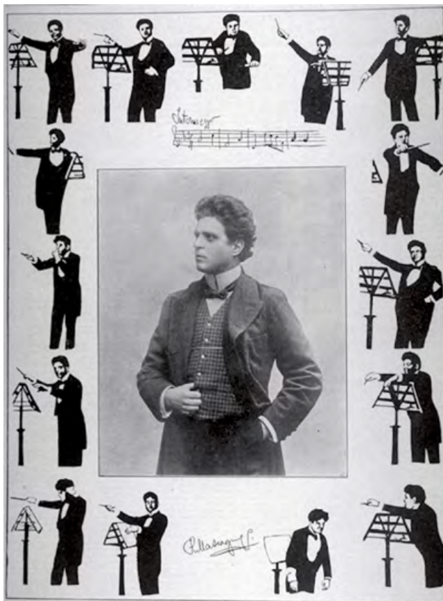
L'Europe reconnaissait les qualités de chef d'orchestre de Mascagni depuis une décennie. Le critique du Herald est conquis : « Tantôt avec fermeté, tantôt avec souplesse, et à l'aide de la baguette que manie élégamment sa main droite, il dessine dans l'espace les nuances recherchées, accélérant le tempo et passant graduellement du pianissimo au forte, se laissant emporter tel un cavalier qui, armé de son sabre, mène la marche. »