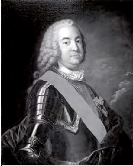
Portrait de Pierre de Rigaud de Vaudreuil de Cavagnial (1698-1778), marquis de Vaudreuil, qui reçoit une commission d'enseigne à l'âge de dix ans sous recommandation de son père, Philippe Rigaud de Vaudreuil (1650-1725), marquis de Vaudreuil, qui est à ce moment gouverneur de la Nouvelle-France.