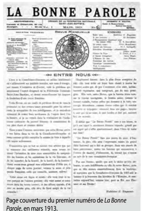
Page couverture du premier numéro de La Bonne Parole , en mars 1913.