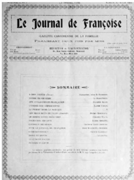
Page couverture du premier numéro du Journal de Française , en mars 1902.

tion des enfants, et bien sûr la myriade de produits de beauté, crèmes, pilules et autres remèdes pensés spécialement pour elles. À côté des annonces, les journaux publient des textes signés par des femmes, puis des chroniques écrites par et pour elles. S'ensuivent de complètes « pages féminines », ces feuillets hebdomadaires dans lesquels une journaliste offre quelques textes choisis, en plus de répondre aux questions des lecteurs, qu'il s'agisse d'affaires sentimentales, de littérature ou des règles d'étiquette. Sortes d'ancêtres du courrier du cœur, ces « réponses aux correspondants » propulsent la carrière des premières chroniqueuses-vedettes du Québec, celles-là mêmes qui deviendront trois des premières directrices de revues. Il s'agit de Française, nom de plume de Robertine Barry, qui dirige le